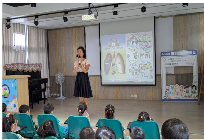
114-1開學典禮，校長進行菸害防制宣導

2-1-1 學校領導者與行政團隊運用多元管道(如：line、臉書、活動、會議、標語、家長座談等)，倡議健康促進學校的重要性