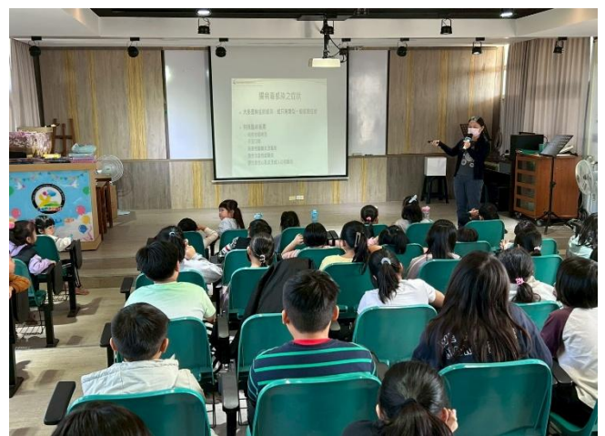
114-1期末休業式，學務組長進行 腸病毒 宣導