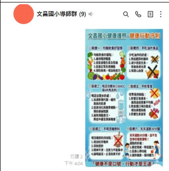
利用 Line 群組，請導師轉傳班群，進行健康促進宣導( 健康護照與行動守則 )