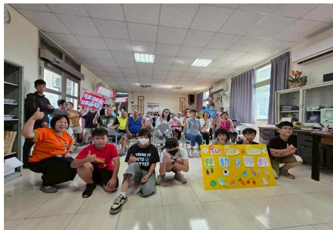
於社區關懷活動時向社區長輩宣導健康促進議題~ 視力保健、拒菸及登革熱防治