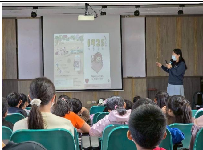
114-2期初開學，學務組長進行 正向心理自殺防治 宣導