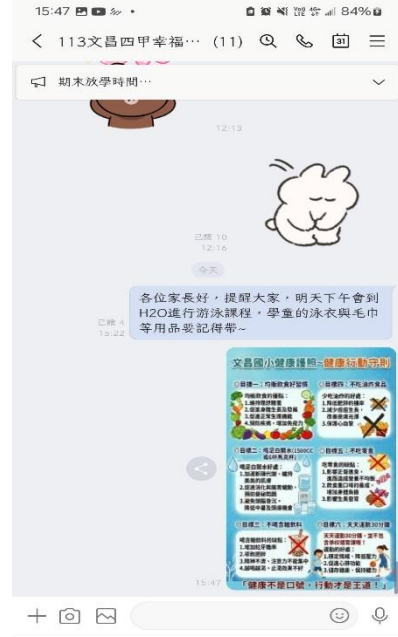
導師利用 班群 向家長宣導 (健康護照與行動守則) (四年級)