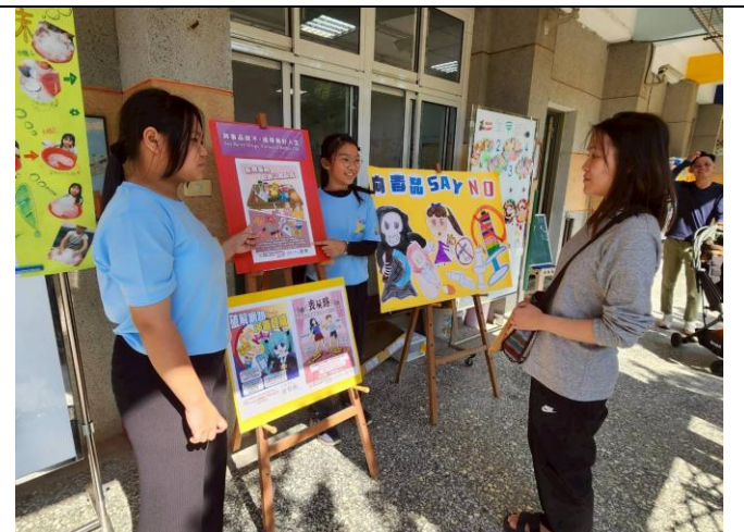
學生向家長進行 正確用藥 及 電子菸 的危 害宣導