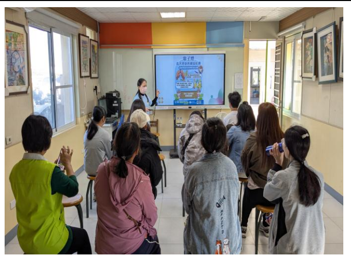
校慶時向家長宣導提醒 電子菸 可能隱藏毒品：依托咪酯