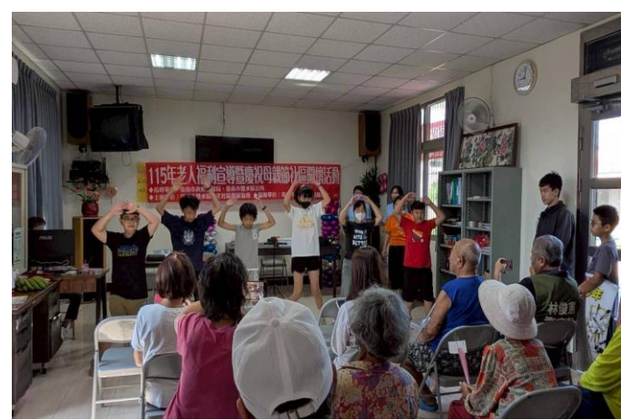
於社區關懷活動時向社區長輩宣導健康促進議題~ 健康體位與多運動