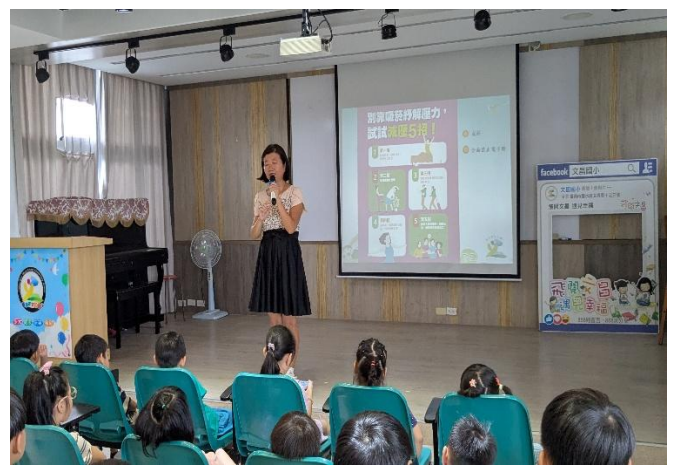
114-1開學典禮，校長進行菸害防制宣導