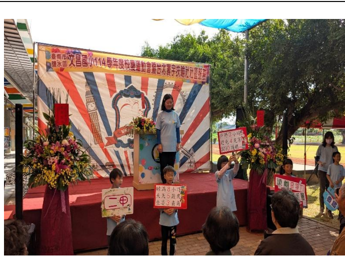
校慶時向來賓及社區家長宣導健康促進議題~ 視力保健