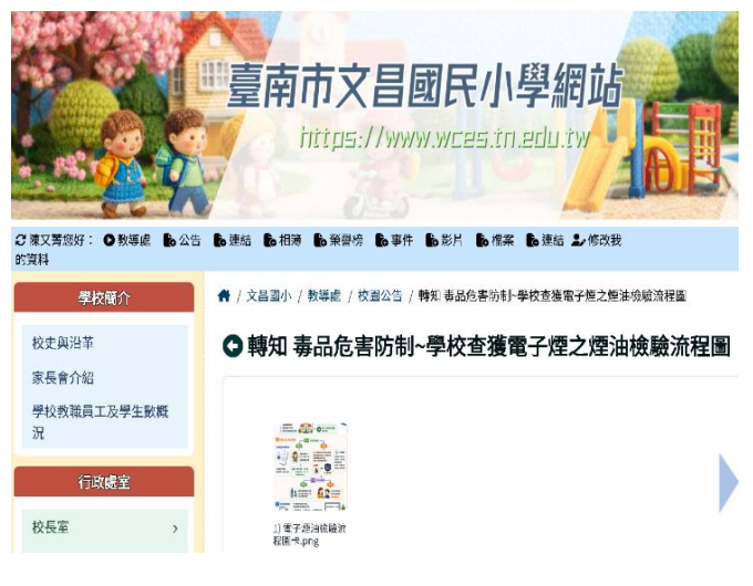
利用學校網站進行菸害防制宣導(電子菸)