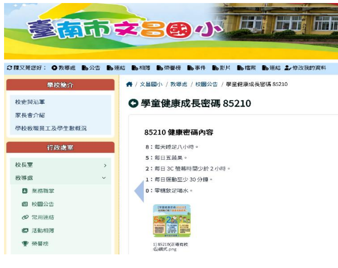
利用學校網站宣導學童健康成長密碼 85210的概念