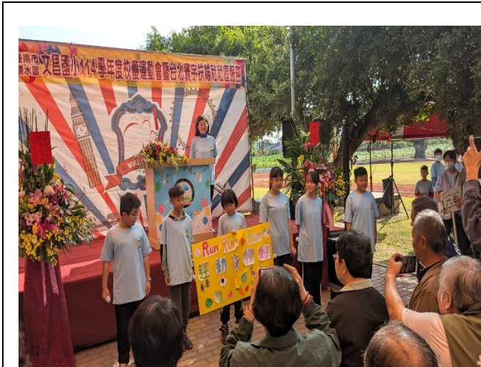
校慶時向來賓及社區家長宣導健康促進議題~ 健康體位與多運動