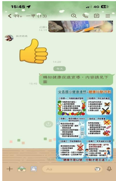
導師利用 班群 向家長宣導 (健康護照與行動守則) (一年級)