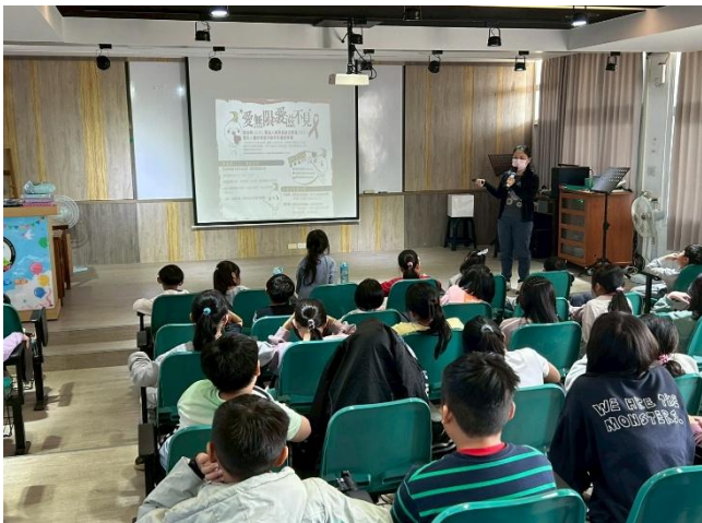
114-1期末休業式，學務組長進行 愛滋病 宣導