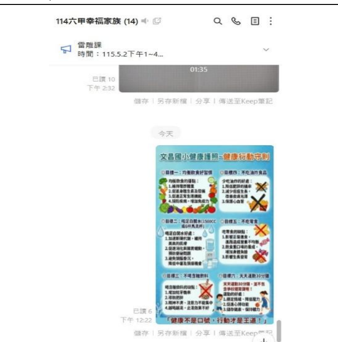
導師利用 班群 向家長宣導( 健康護照與行動守則 )(六年級)