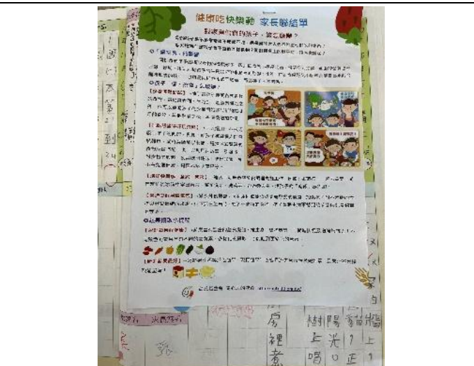
利用聯絡簿向家長宣導健康吃快樂動