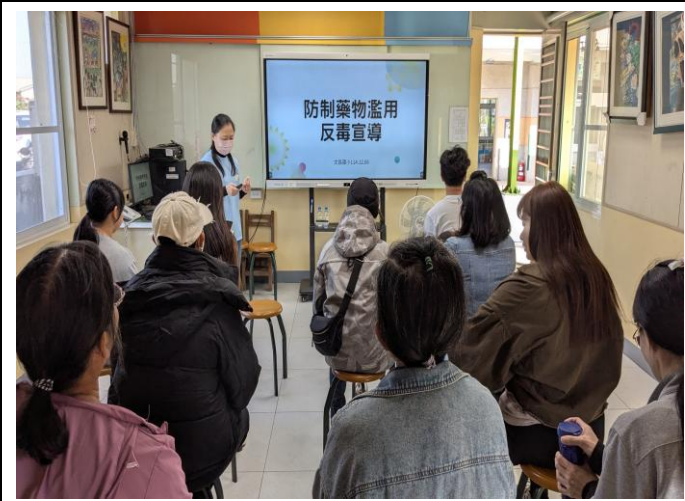
校慶時向家長宣導 正確用藥 、防制藥物濫用