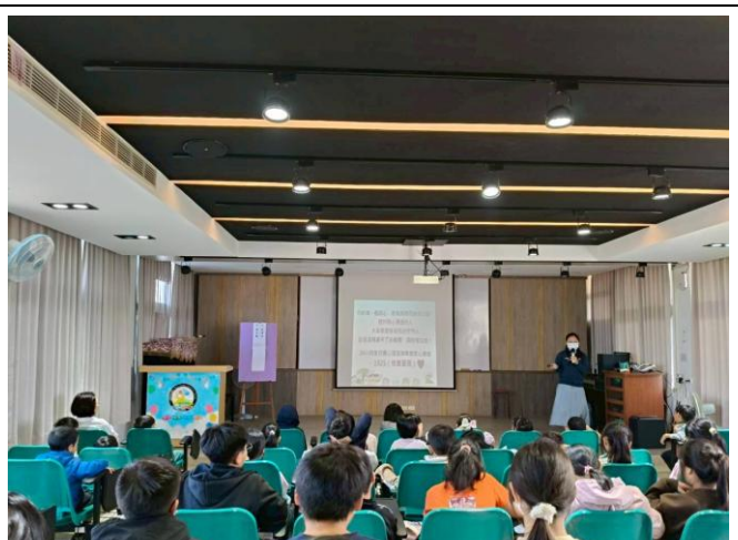
114-2期初開學，學務組長進行 正向心理自殺防治 宣導