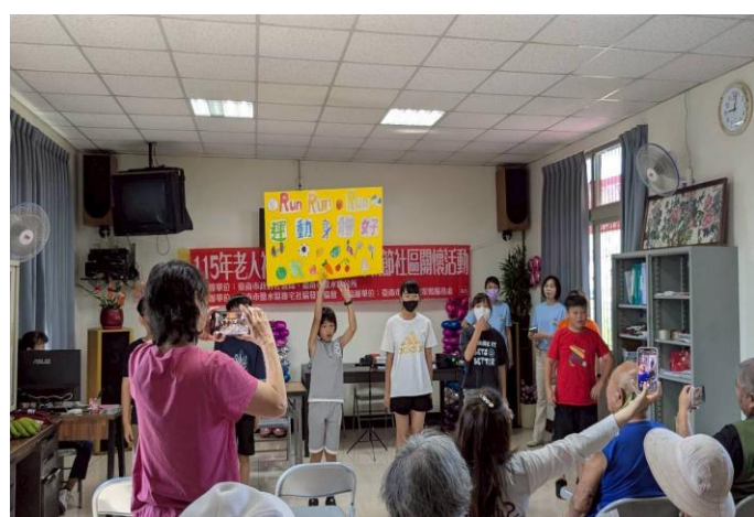
於社區關懷活動時向社區長輩宣導健康促進議題~ 健康體位與多運動