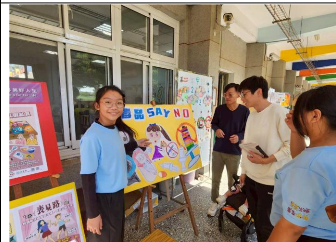
學生向家長進行防制 藥物濫用 宣導