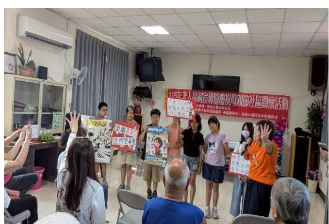
於社區關懷活動時向社區長輩宣導健康促進議題~ 視力保健、拒菸及登革熱防治