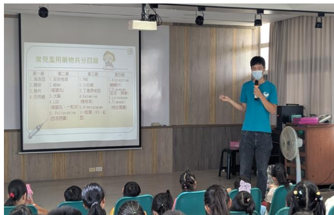
藥師向學生說明常見 濫用藥物分四級