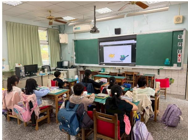
餐前5分鐘-堅果種子2(三甲)