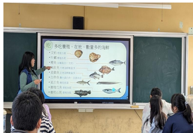
教導學生多吃在地海鮮，培養低碳飲食的概念