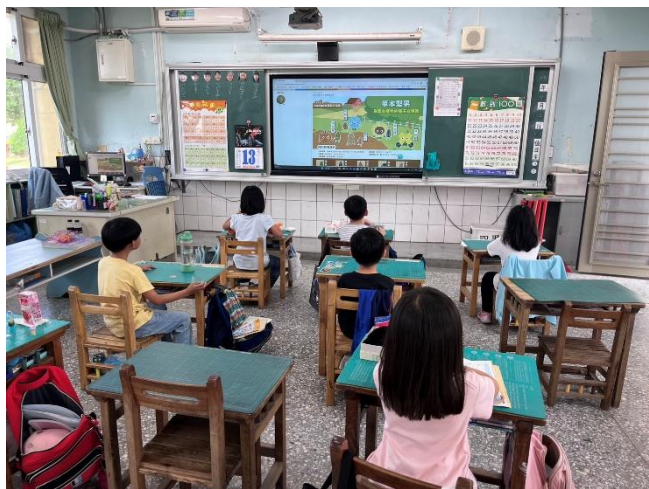
餐前5分鐘-草本堅果(一甲)