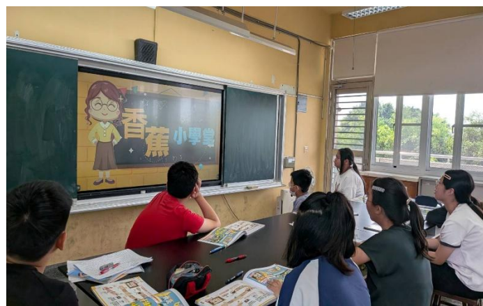
觀看香蕉小學堂影片