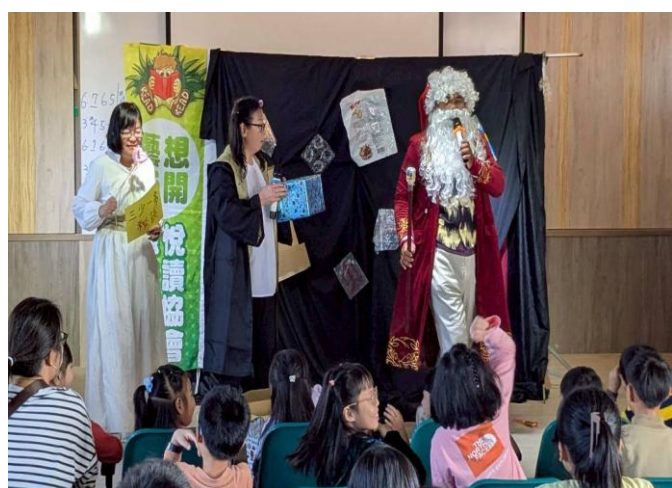
演員利用生動活潑的表演方式，教導學生 能源、衛生永續與環保 概念