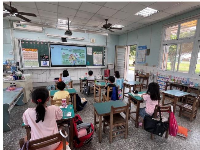
餐前5分鐘-健康餐盤(一甲)