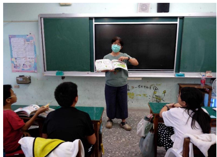
餐前 5 分鐘-書籍介紹(六甲)