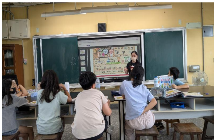
觀看餐前五分鐘專書 31-33 頁(魚)