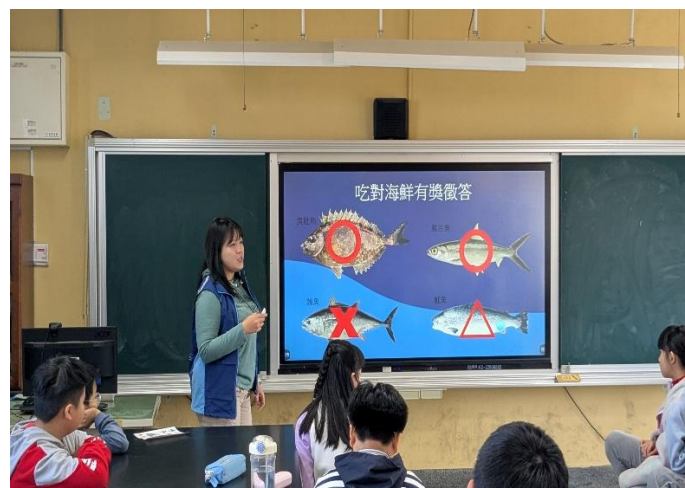
進行吃對海鮮有獎徵答小遊戲