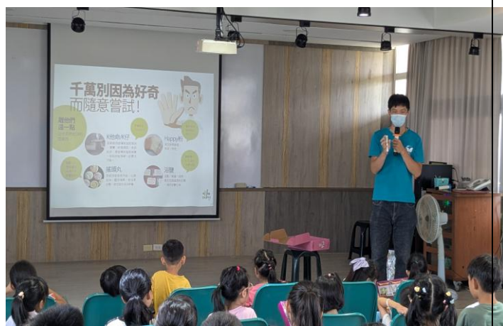
藥師提醒學生， 勇敢向毒品說不