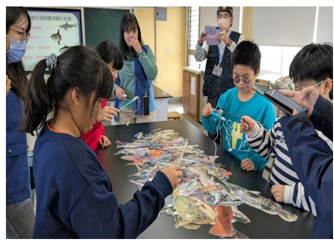
進行認識在地魚類小遊戲