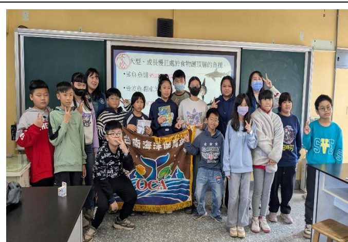
海洋保育署 台南海洋保育站到校進行飲食(食魚)教育