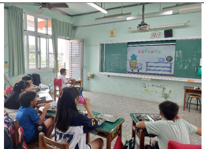
餐前5分鐘-小小標籤，大大學問(五甲)