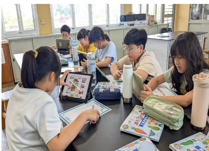
學生參考餐前五分鐘主題海報，認真書寫學習單