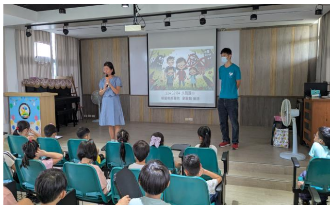
校長介紹柳營奇美醫院的講師