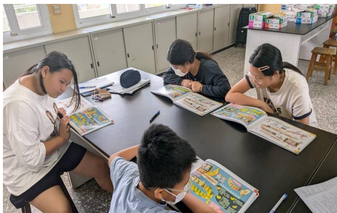
觀看餐前五分鐘專書 89-91 頁(香蕉)