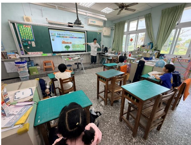
餐前5分鐘-愛恨交織的香菜(二甲)