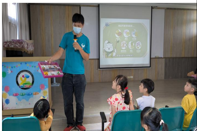
仔細觀看新興毒品包裝樣態的 仿真品