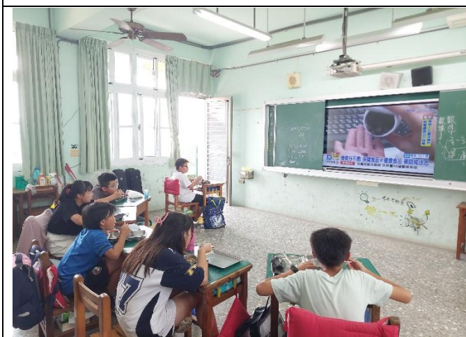
餐前5分鐘影片-五甲