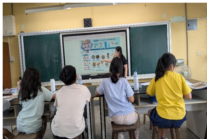
觀看食農遊學地圖(虱目魚特刊)