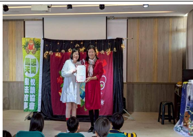
淨零綠校園故事媽媽劇團到校進行能源及環保教育