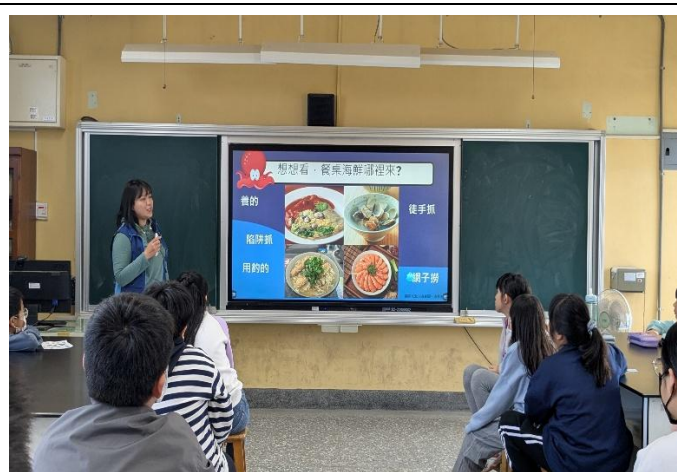
認識餐桌海鮮是如何來的