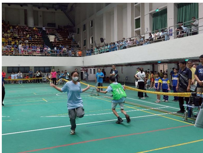
普及化運動：跳繩接力(正式比賽)