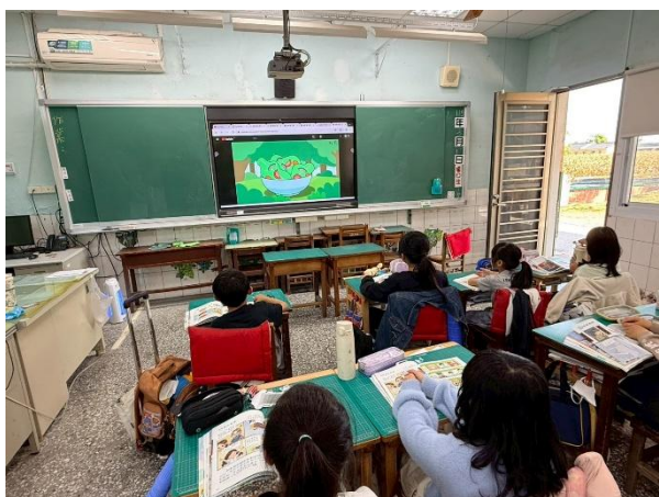
餐前5分鐘-堅果種子1(三甲)