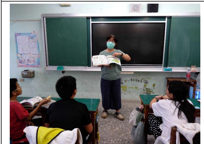
餐前5分鐘-書籍介紹(六甲)