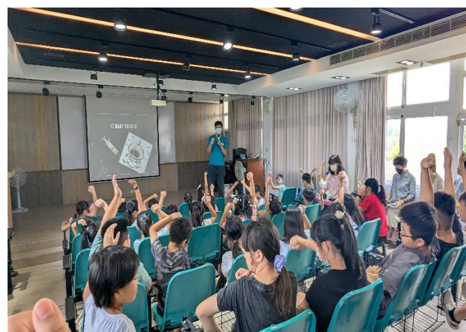
學生和藥師互動熱絡，勇敢回答問題