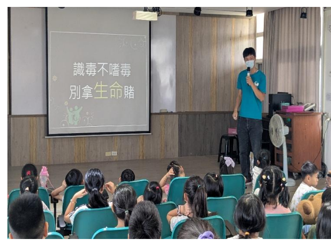
藥師提醒學生藥品和毒品不同