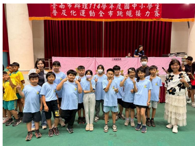
普及化運動：跳繩接力