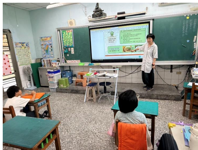
餐前5分鐘-愛恨交織的香菜(二甲)