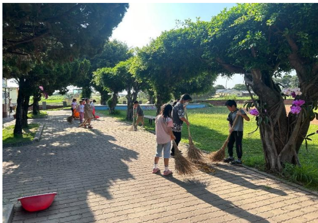
學生參與校園美化綠化工作