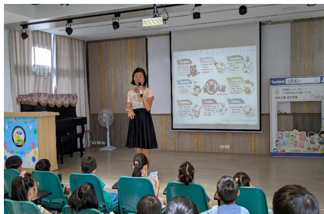
校長於開學時進行反毒宣導