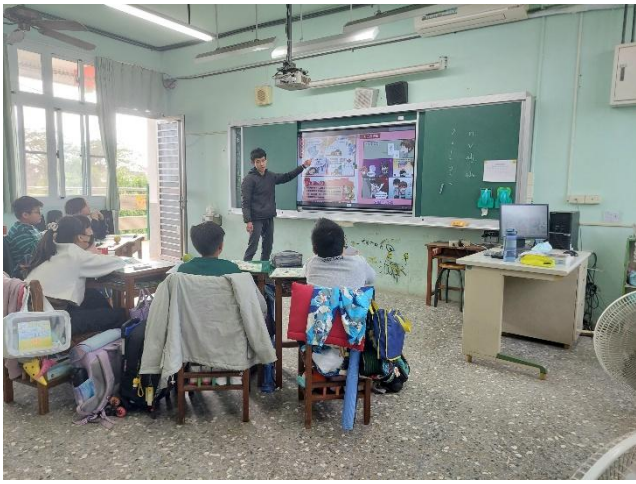
融入教學：反毒電子書-漫畫專區特別篇