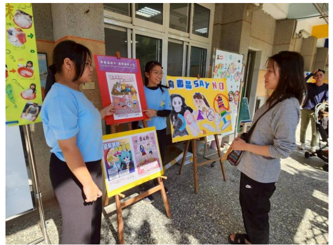
學生向家長進行正確用藥及電子菸的危害宣導