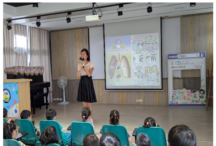
校長於開學時進行菸害防制宣導