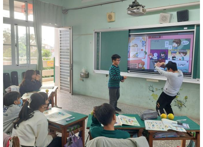
學生進行角色扮演~如何向毒品說不