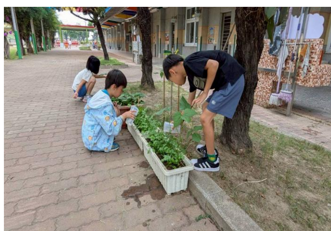
學生每天幫植物澆水