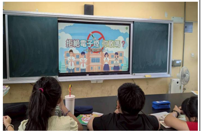
融入教學：電子菸的危害