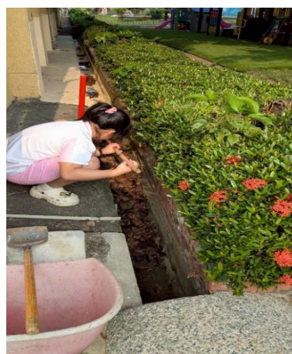
環境清潔日學生協助水溝疏通作業