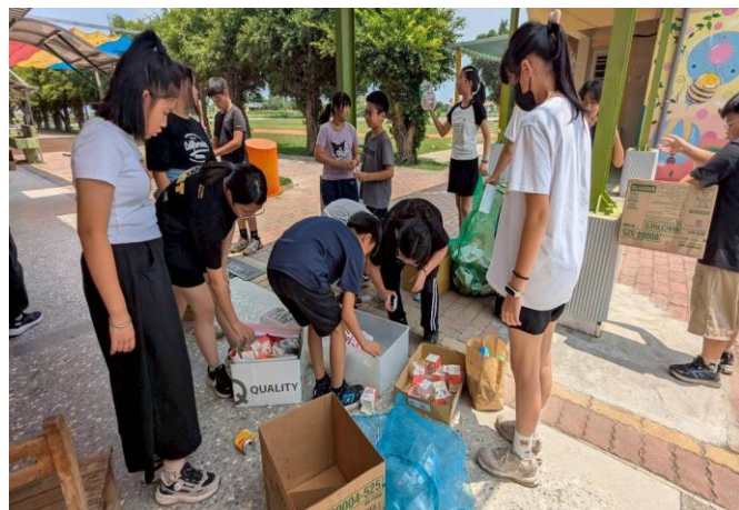
每週五環保小尖兵協助資源回收