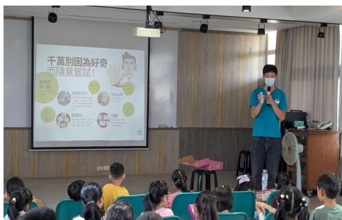
奇美醫院藥師提醒學生，向毒品說不