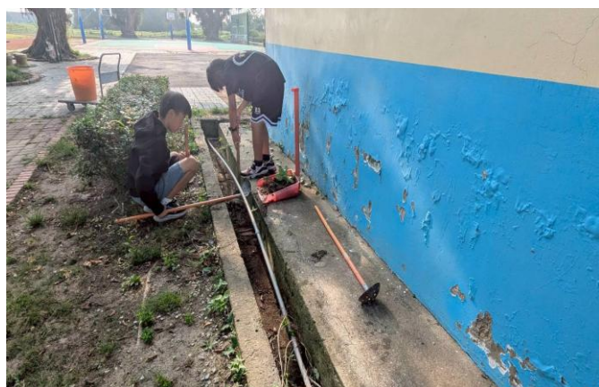
每週三整潔小尖兵協助登革熱防治作業