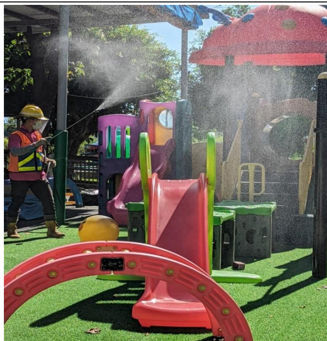
定期進行環境清消，降低登革熱疫情發生