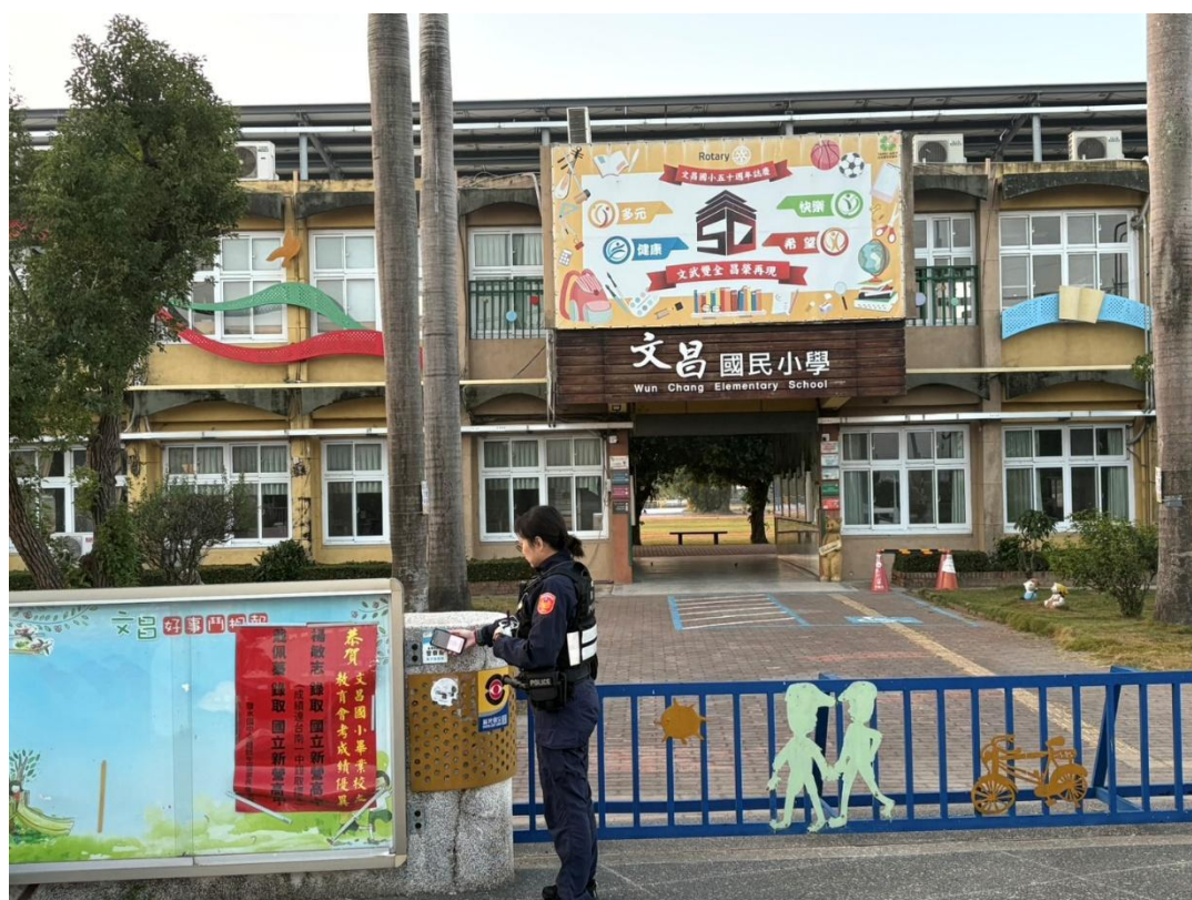
校園周邊熱點巡邏執行成果