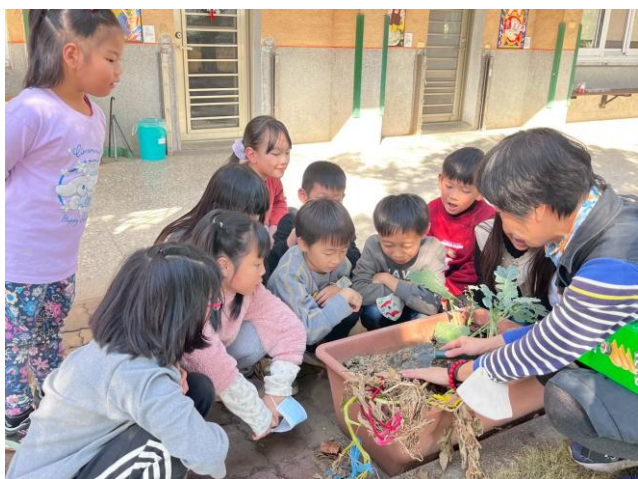
利用教室前花圃進行蔬菜種植與觀察