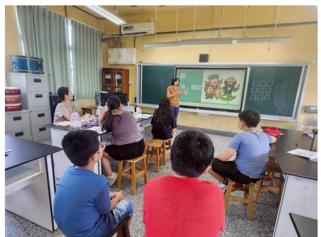
反毒入班宣導：新吸遊記