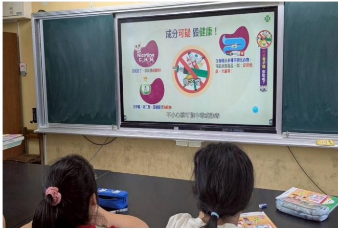
融入教學：電子菸的可疑成分與危害