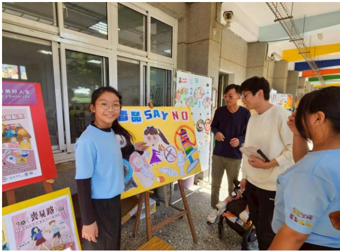
學生向家長進行防制藥物濫用宣導