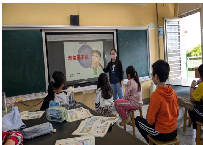
融入教學：中年級反毒繪本-危險藥不藥