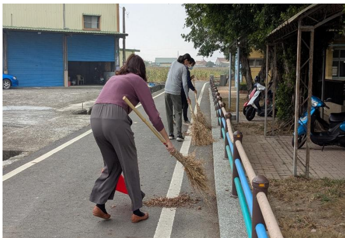
開學前進行校園內外環境整理