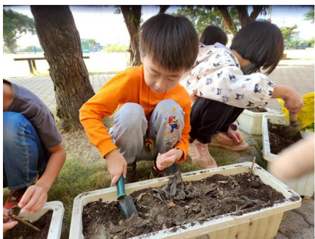
學生學習鬆土，準備種植