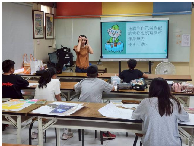
反毒入班宣導：吸食毒品的後果