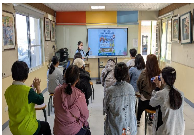
校慶時向家長宣導，提醒電子菸可能隱藏毒品：依托咪酯