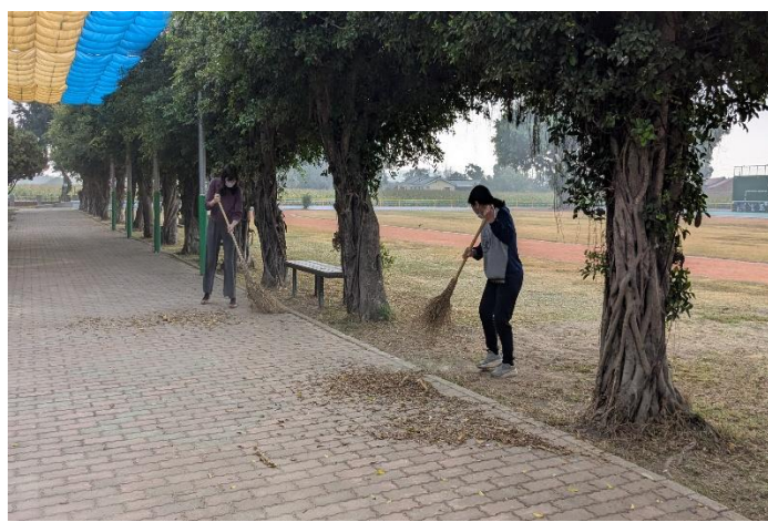
開學前進行校園內外環境整理