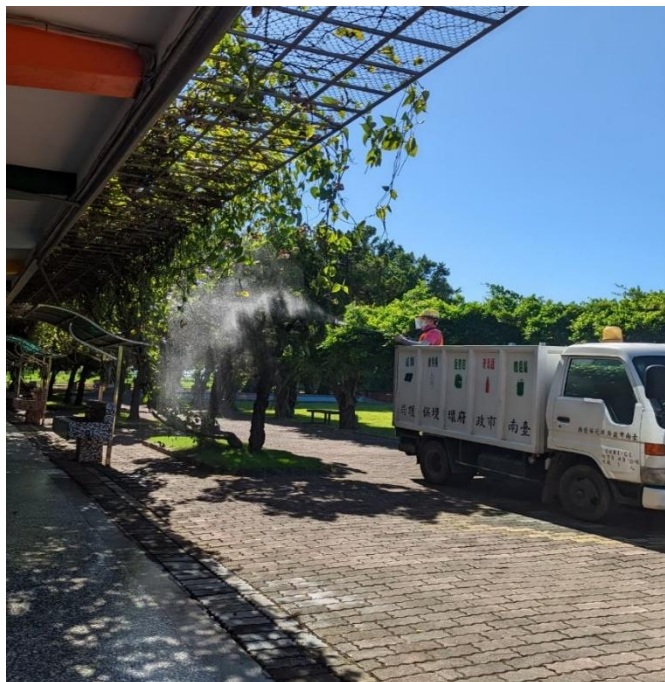
開學前由防疫消毒大隊執行戶外消毒