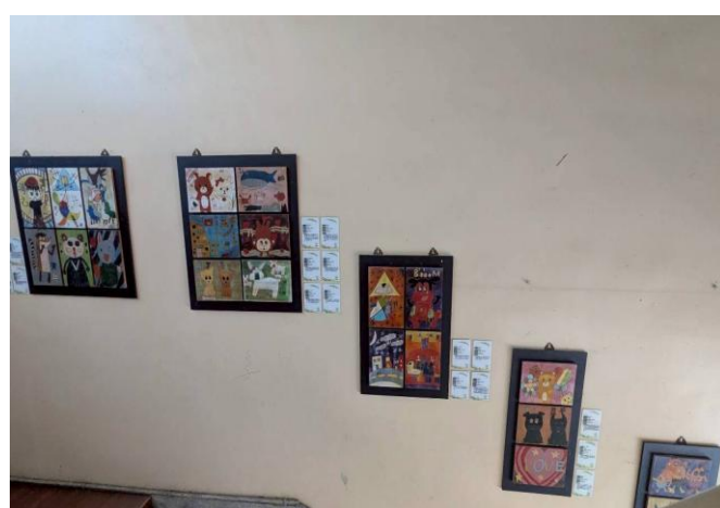
樓梯間美化，佈置學生作品