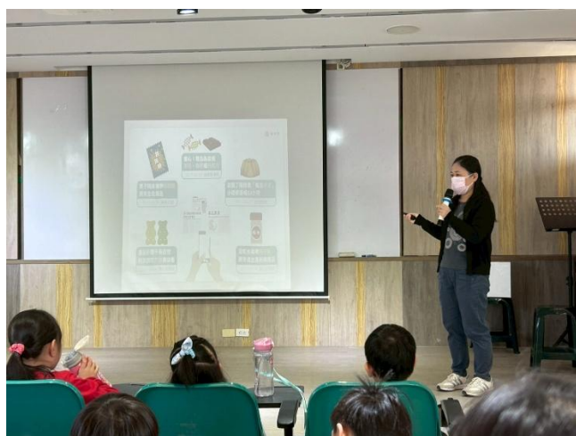
學務組長於休業式時進行反毒宣導