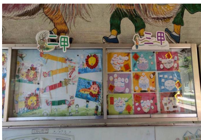
藝術小天使佈置各班的作品於中廊