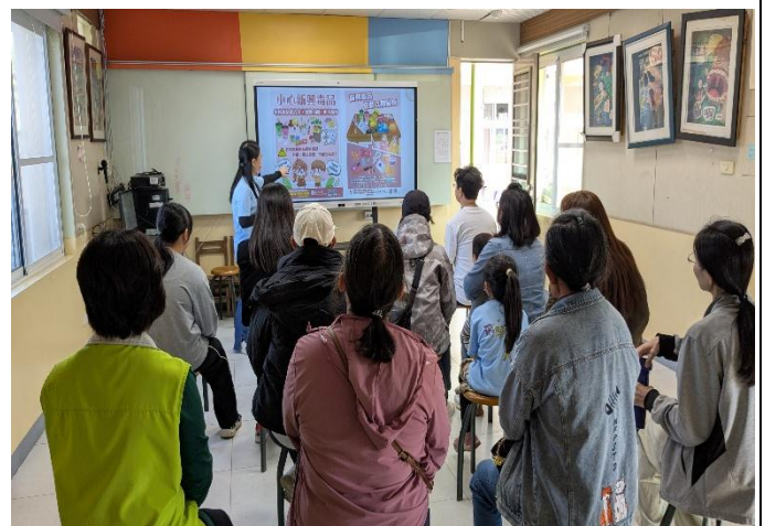
校慶時向家長宣導，請家長們留意新興毒品的包裝樣態