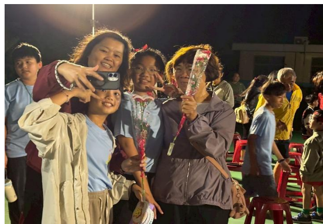
家長熱情參與，給予孩子鼓勵與掌聲