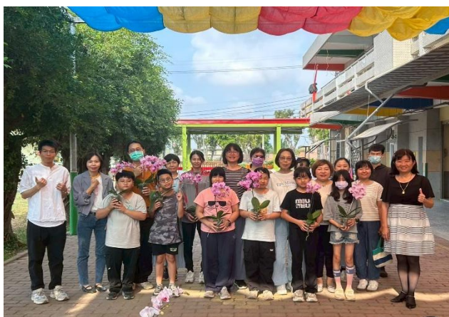
會長與會長夫人贈送全校師生 蘭花 一盆，祝福大家兒童節快樂！