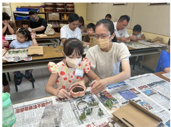
化身綠手指，親子玩園藝