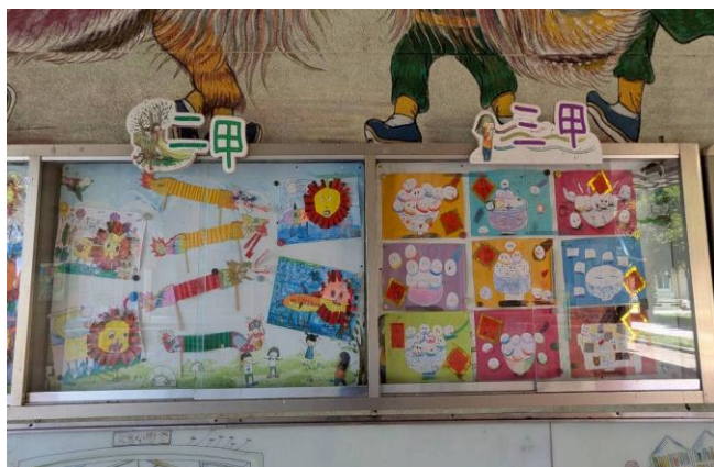
各班利用布告欄，展示藝術創作品