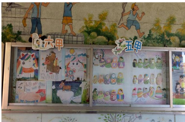
各班利用布告欄，展示藝術創作品