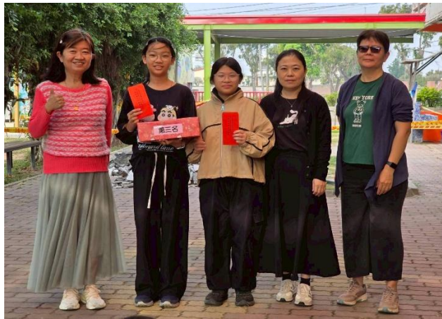
機器人比賽第三名