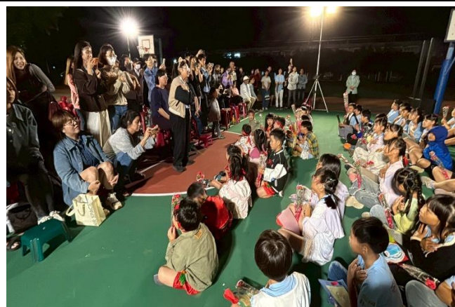
家長熱情參與，給予孩子鼓勵與掌聲