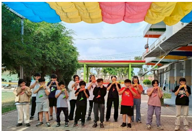
表演活動：陶笛(高年級)