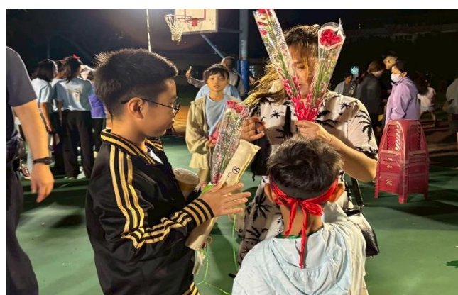
學生贈送媽媽康乃馨，跟媽媽說謝謝