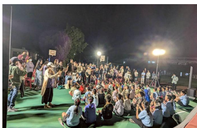
家長熱情參與，給予孩子鼓勵與掌聲