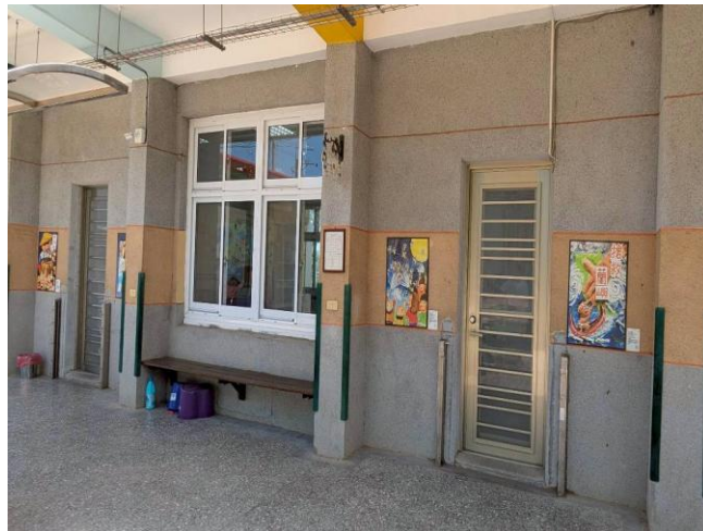
教室外牆上布置了許多學生的藝術品