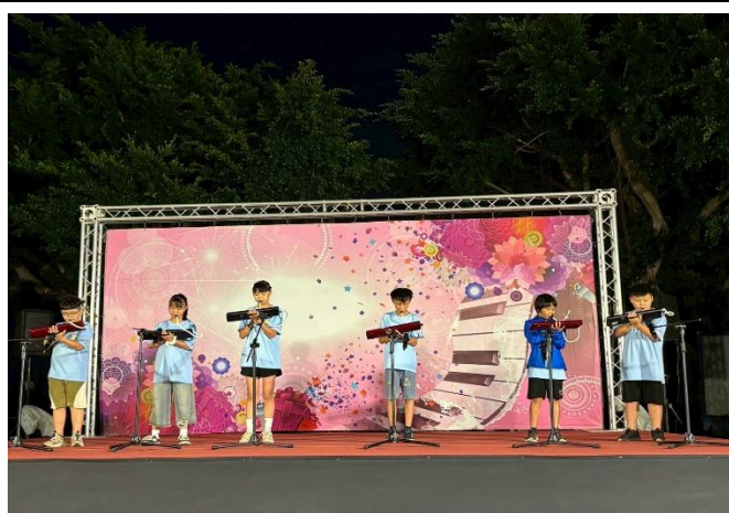
五年級口風琴表演