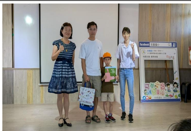
爸爸陪孩子一起參加迎新活動