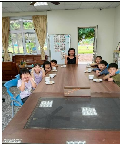
一年級 與校長有約