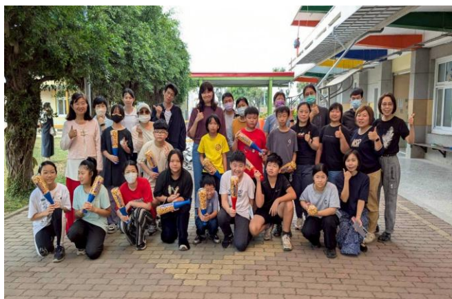
家長贈送全校師生 球棒爆米花 ，祝福大家兒童節快樂，越來越棒！