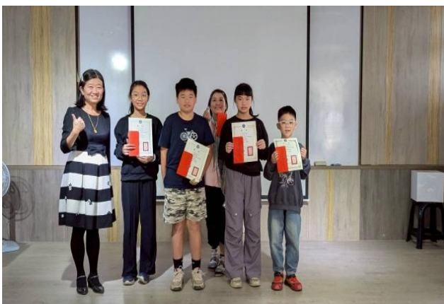
參加 Cool English 比賽