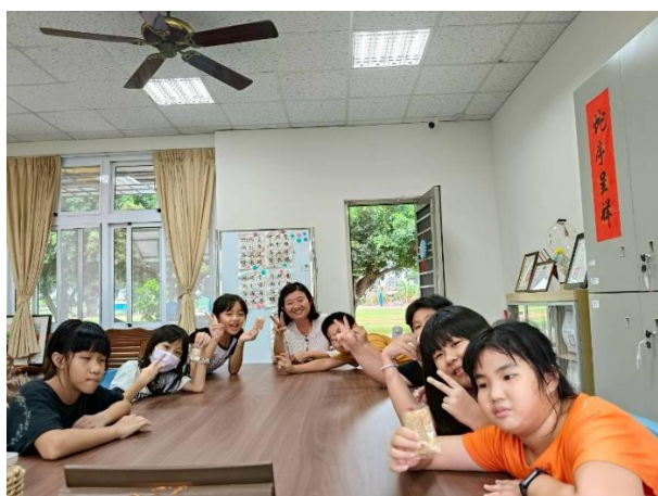
四年級 與校長有約