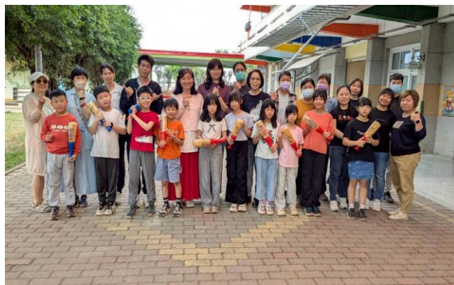
家長贈送全校師生 球棒爆米花 ，祝福大家兒童節快樂，越來越棒！