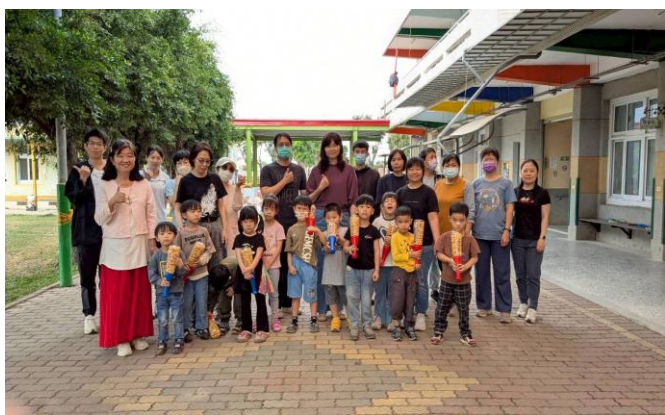
家長贈送全校師生 球棒爆米花 ，祝福大家兒童節快樂，越來越棒！