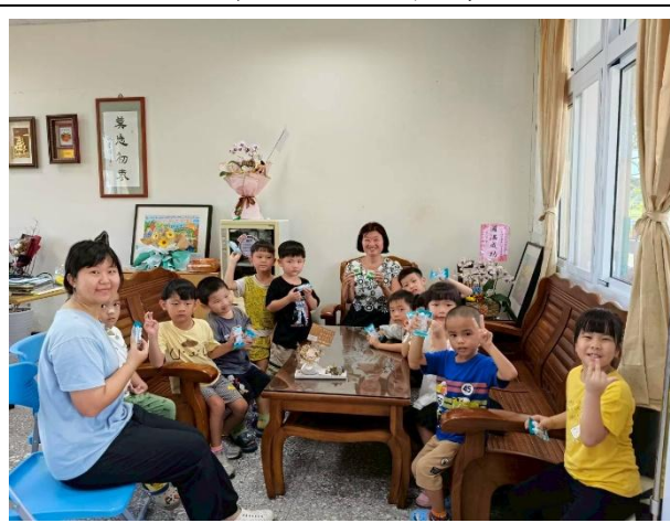
幼兒園 與校長有約