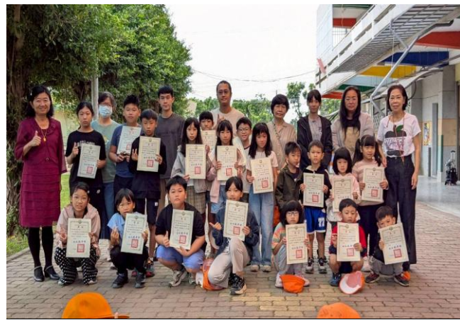
期中綜合表現優異學生