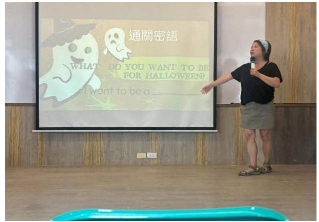
萬聖節結合英文教學