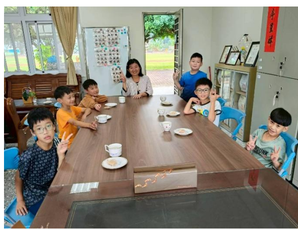
三年級 與校長有約