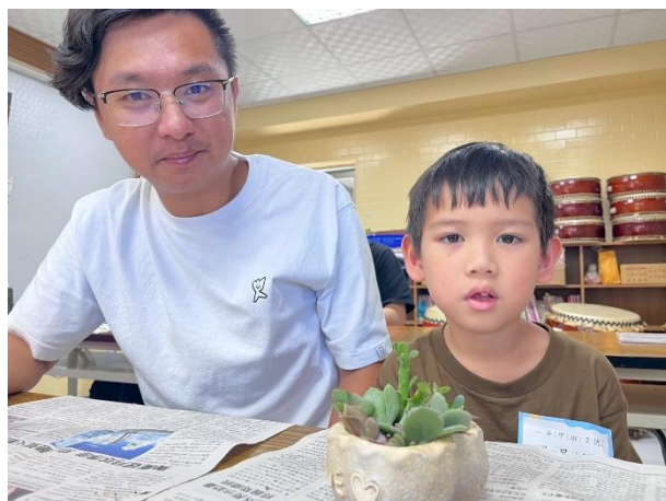
化身綠手指，親子玩園藝