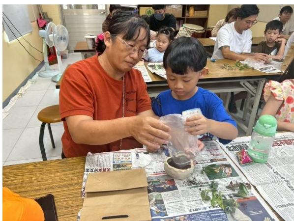
奶奶陪孫子一起種植多肉植物