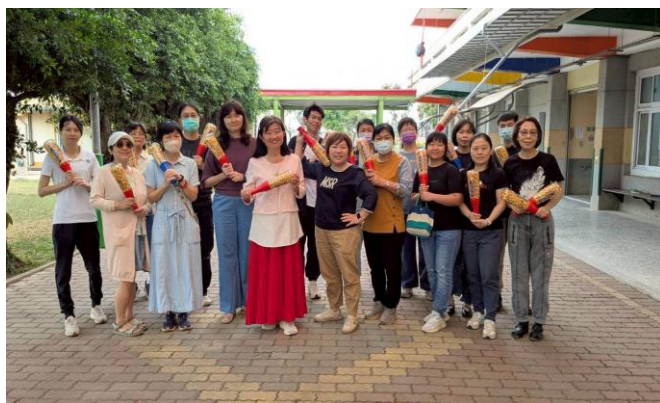
家長贈送全校師生 球棒爆米花 ，祝福大家兒童節快樂，越來越棒！