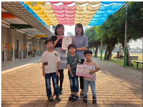
感謝家長贈送全校師生 球棒爆米花