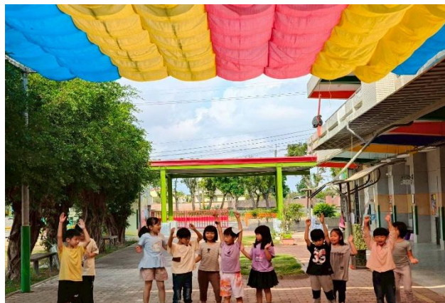
表演活動：英文律動(低年級)