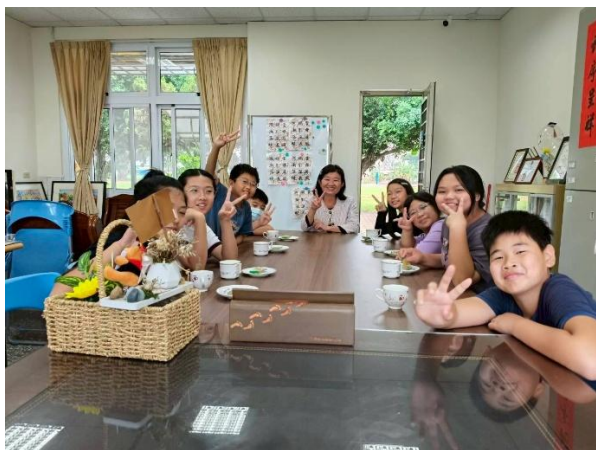
六年級 與校長有約