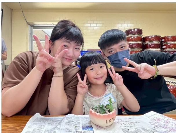
爸爸、媽媽一起陪孩子玩園藝