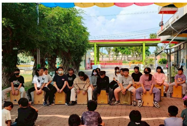
表演活動：木箱鼓(中高年級)