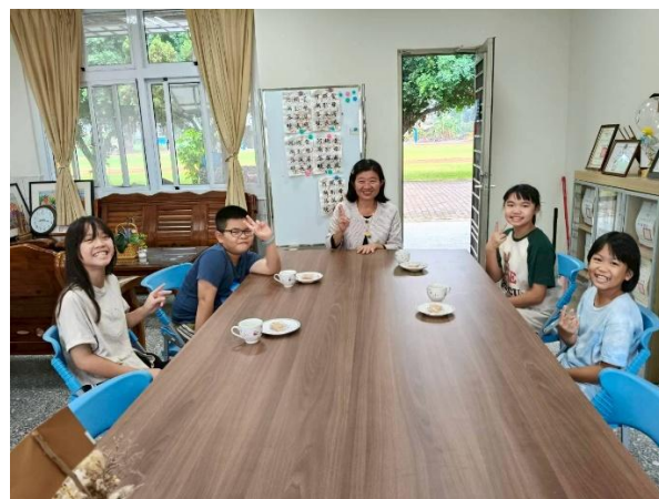
五年級 與校長有約