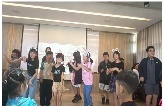
萬聖節律動，學生開心上台互動