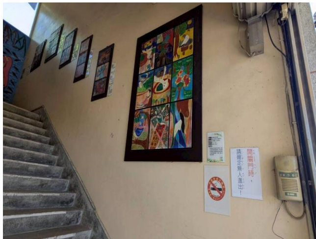
樓梯牆面上布置了許多學生的創作