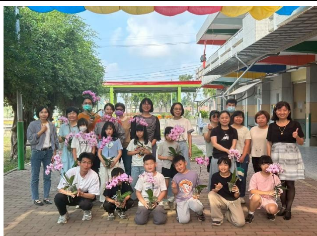
會長與會長夫人贈送全校師生 蘭花 一盆，祝福大家兒童節快樂！