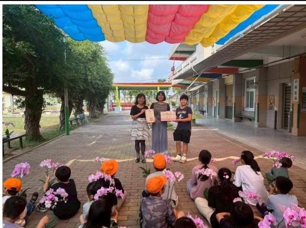
感謝會長與會長夫人贈送全校師生 蘭花