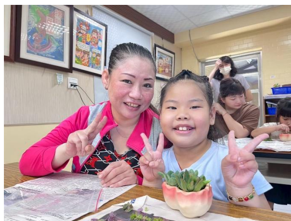
化身綠手指，親子玩園藝