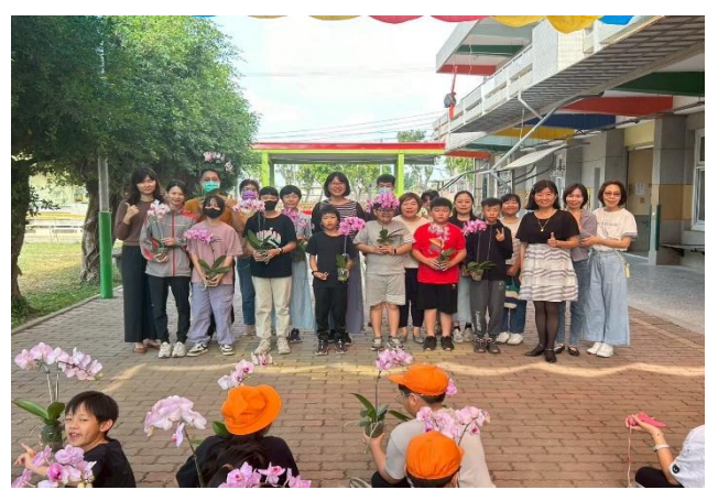
會長與會長夫人贈送全校師生 蘭花 一盆，祝福大家兒童節快樂！