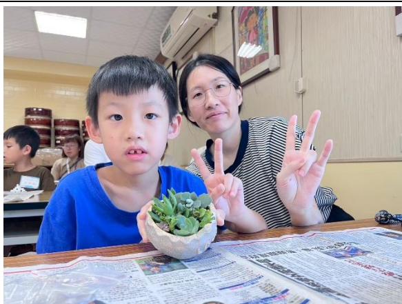
親子共同創作，一起玩園藝