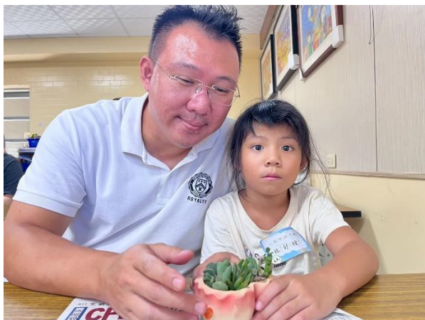
化身綠手指，親子玩園藝