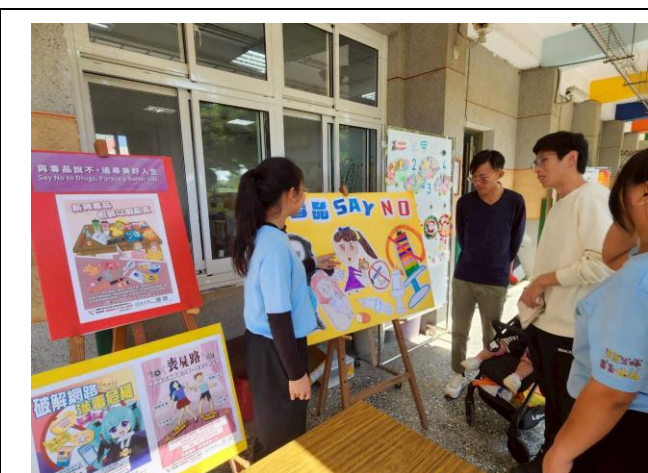
學生向家長說明 反毒創作理念