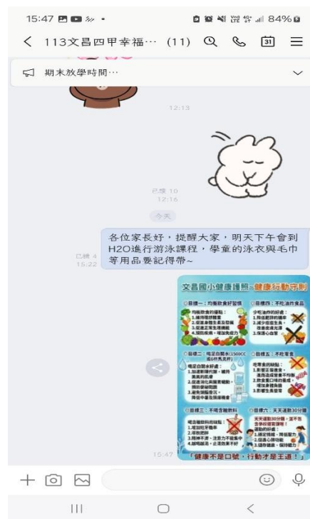
利用 班群(四年級) 向家長宣導健康護照六大健康行動守則