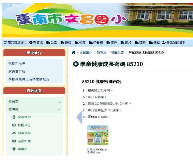
利用學校網站進行宣導(85210)