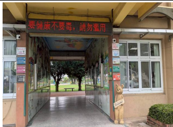
利用跑馬燈進行宣導(藥物濫用)