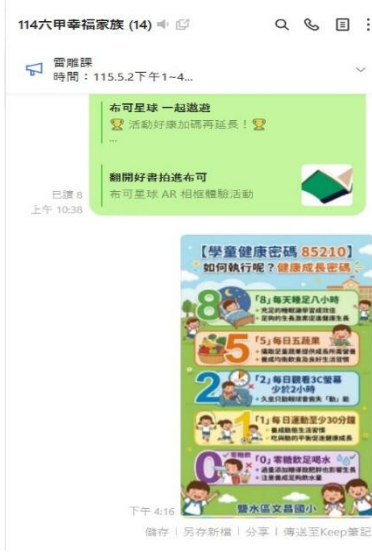
利用班群(六甲)向家長宣導85210