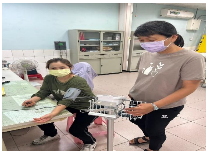
簡易健檢服務—血壓施測