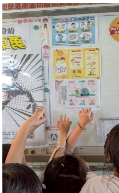
利用 學校公佈欄 進行宣導 (腸病毒)