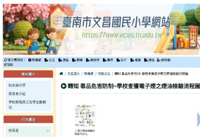
利用學校網站進行宣導(電子菸)