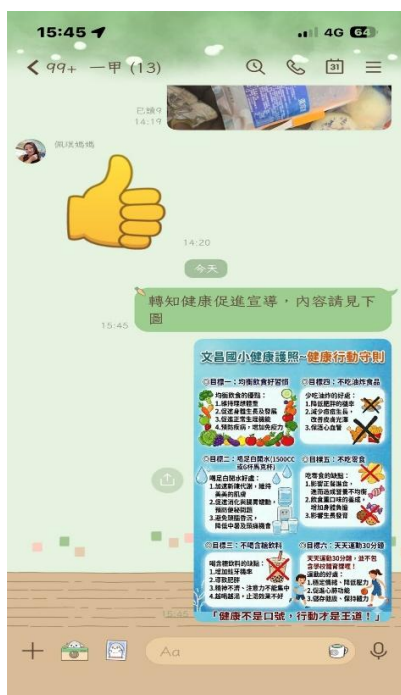
利用 班群(一年級) 向家長宣導健康護照六大健康行動守則