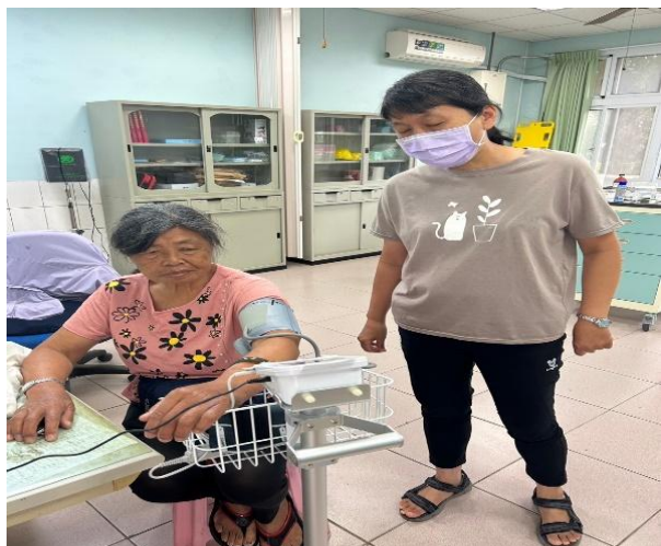
學校提供民眾簡易健檢服務(血壓施測)