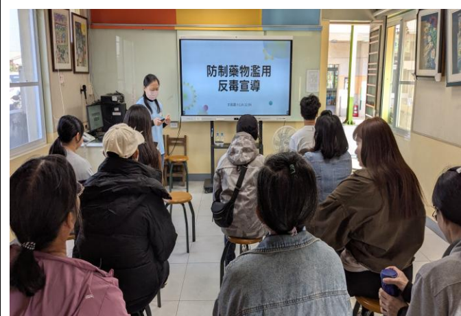
校慶時辦理家長 防制藥物濫用 宣導