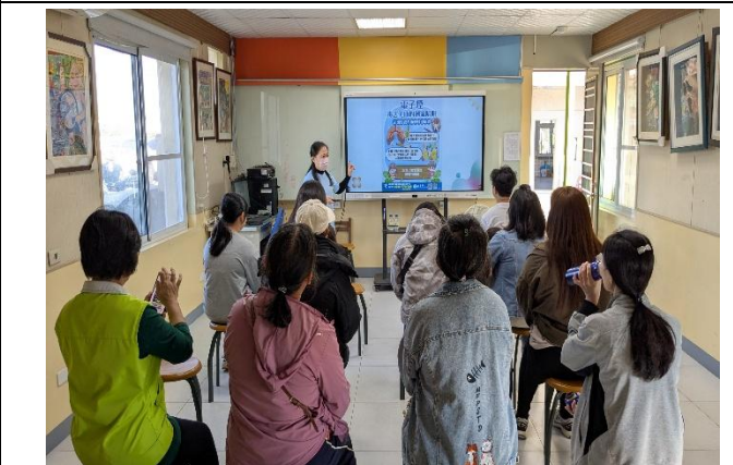
提醒 電子菸 可能隱藏毒品：依託咪酯