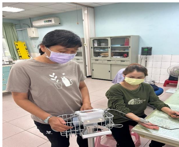
學校提供民眾簡易健檢服務(血氧施測)