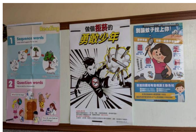
利用 學校公佈欄 進行宣導 (拒菸及登革熱)