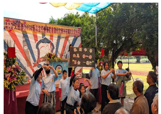
校慶時向來賓及社區家長進行 性別平等 議題宣導(六年級)，促進家庭健康關係