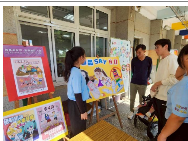
學生向家長說明 反毒創作理念