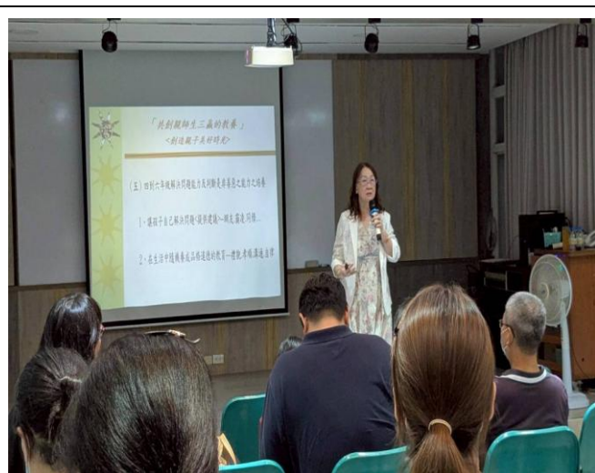
如何共創親師生三贏的教養