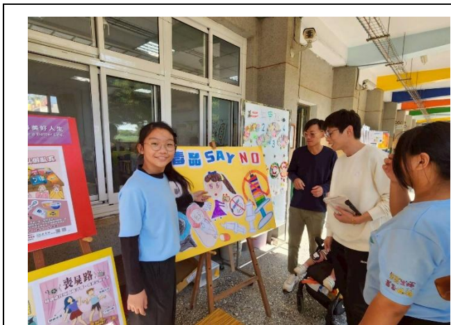
學生向家長進行 正確用藥 宣導