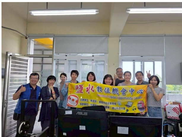
家長踴躍參與數位學習課程