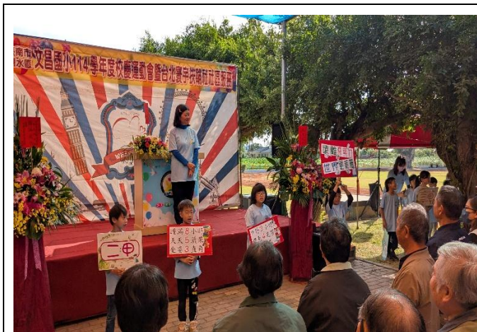
校慶時向來賓及社區家長進行 視力保健 議題宣導(二年級)