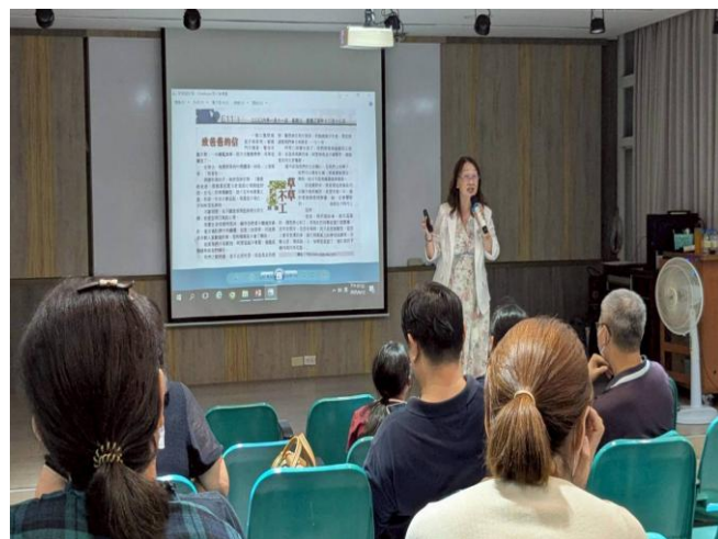
講師分享教養案例