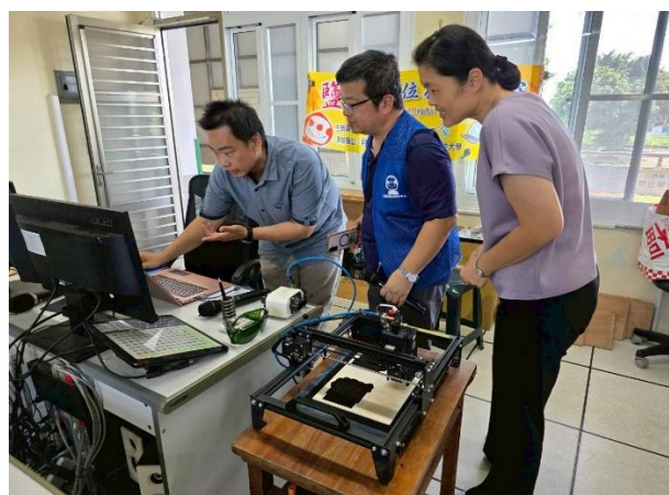
體驗雷射雕刻課程