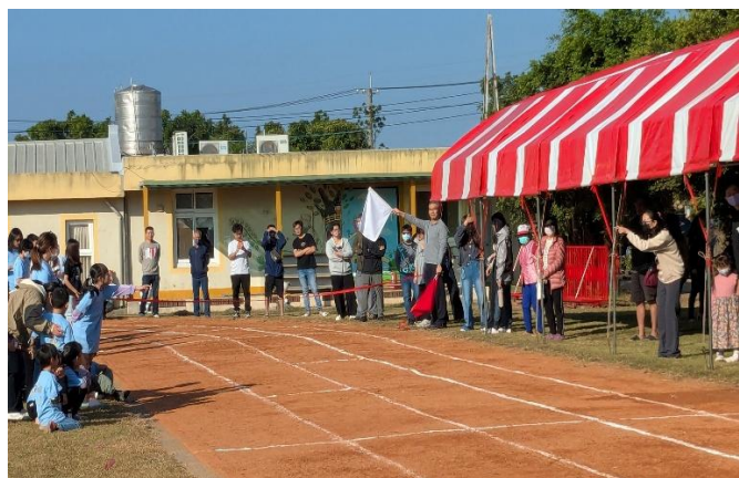
家長踴躍參與，並擔任終點裁判