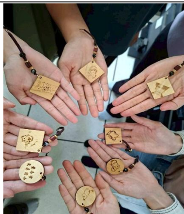
展現創意與數位的學習成果