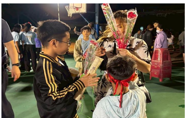
學生贈送媽媽康乃馨，跟媽媽說謝謝