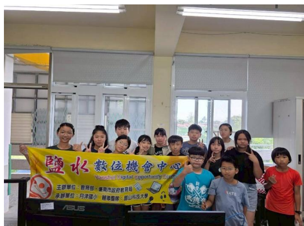
學生與家長一同參與數位學習課程