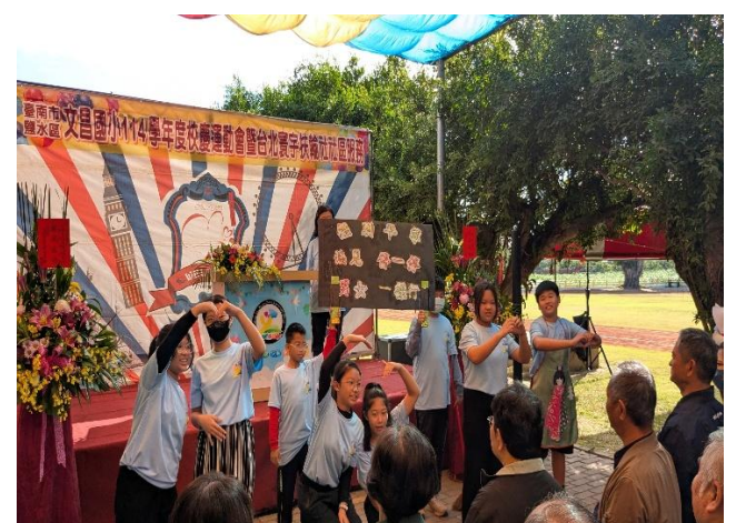
校慶時向來賓及社區家長進行 性別平等 議題宣導(六年級)，促進家庭健康關係