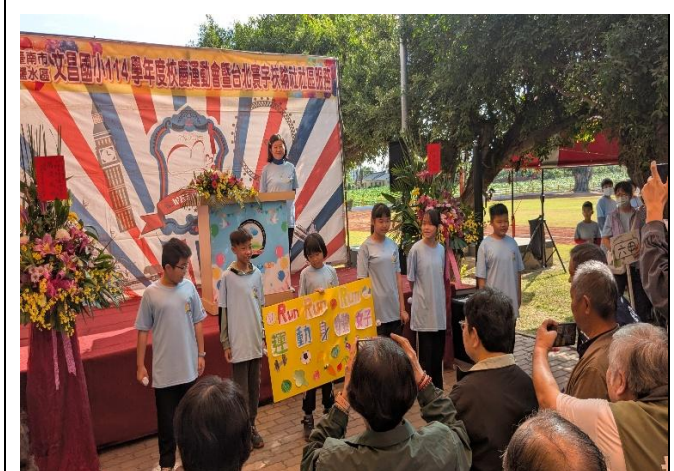
校慶時向來賓及社區家長進行 健康體位多運動保健康 宣導(五年級)