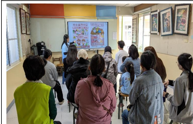
請家長們留意 新興毒品 的包裝樣態