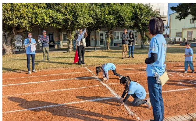
家長踴躍參與，並擔任起點裁判