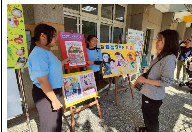
學生向家長進行 防制藥物濫用 宣導