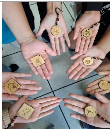
完成獨一無二的專屬作品