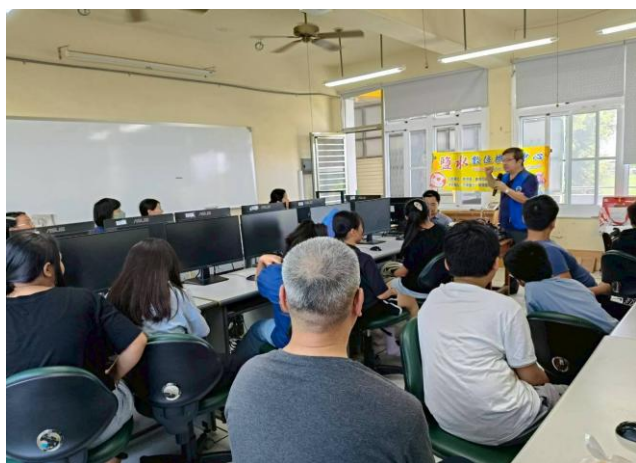
學生與家長一同參與數位學習課程