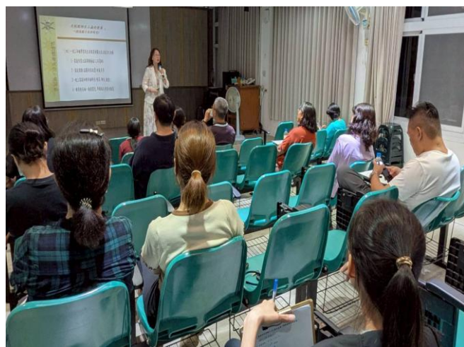
家長熱情參與，一同關心親子教養問題