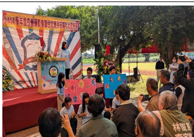
校慶時向來賓及社區家長進行 拒絕網路成癮 議題宣導(四年級)