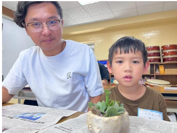
化身綠手指，親子玩園藝