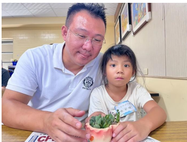
化身綠手指，親子玩園藝