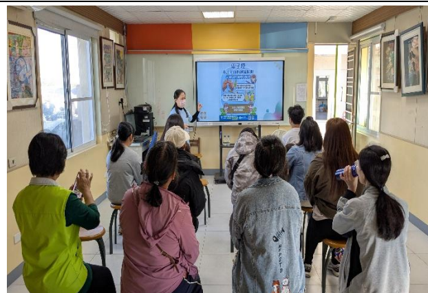
提醒 電子菸 可能隱藏毒品：依托咪酯