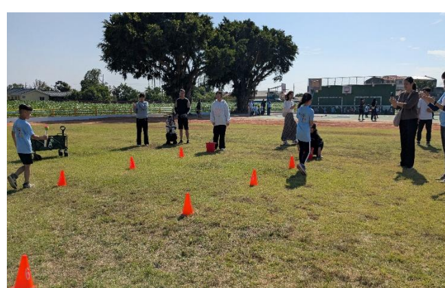
家長熱情參與趣味競賽，為學生加油