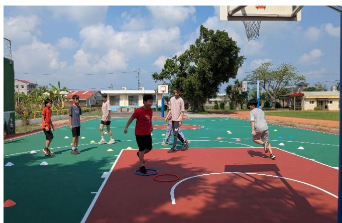
晨間運動時間-體能訓練