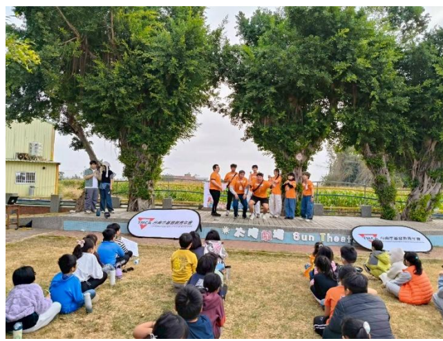
大地遊戲關卡介紹