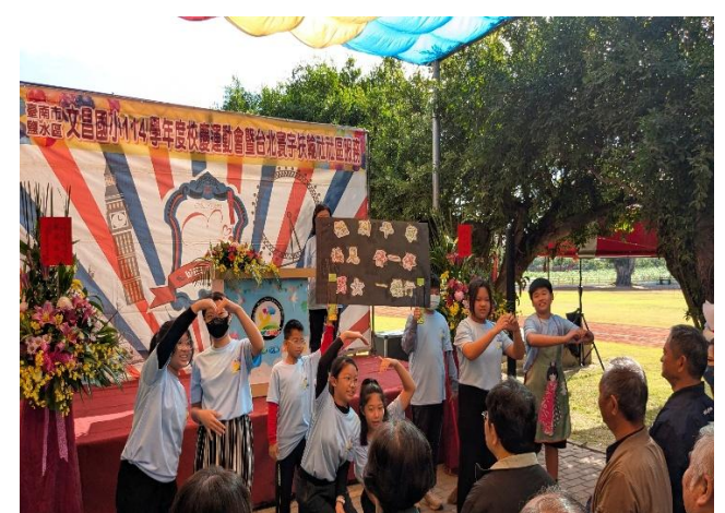
校慶時向來賓及社區家長進行性別平等議題宣導(六年級)，促進家庭健康關係