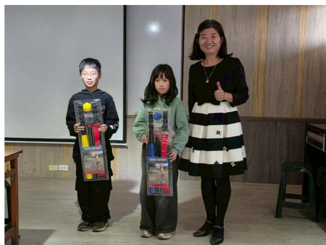
添購 樂樂棒球 作為大跑步計畫之摸彩品