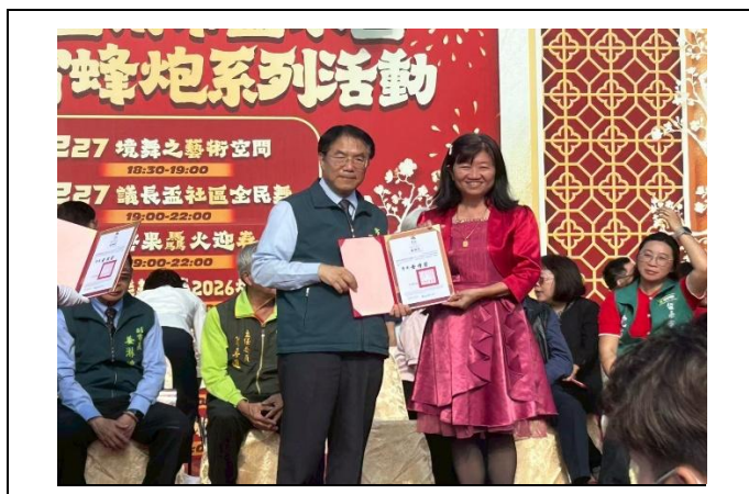
參加在鹽水區舉辦的囡仔仙拚仙活動