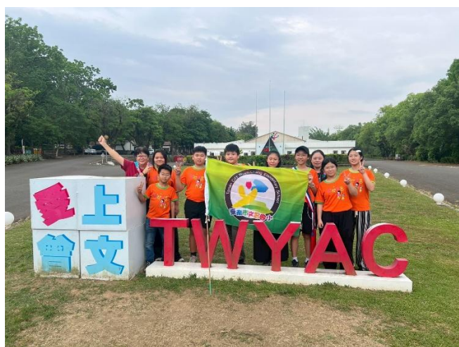
到曾文活動中心進行2天1夜露營活動