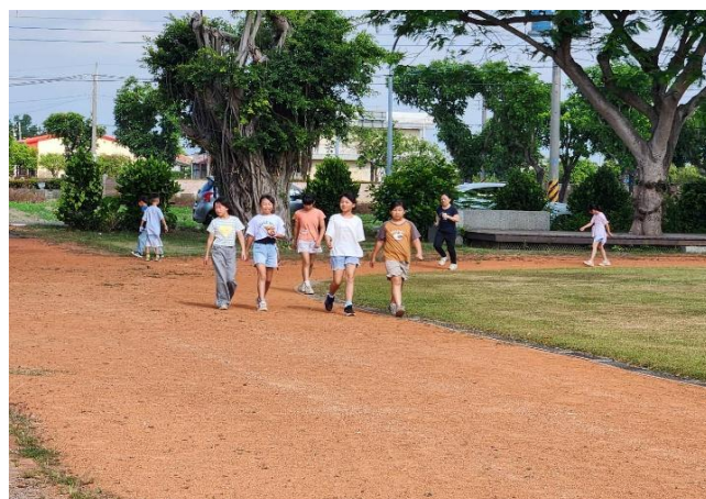
週三、五晨間運動時間-跑步