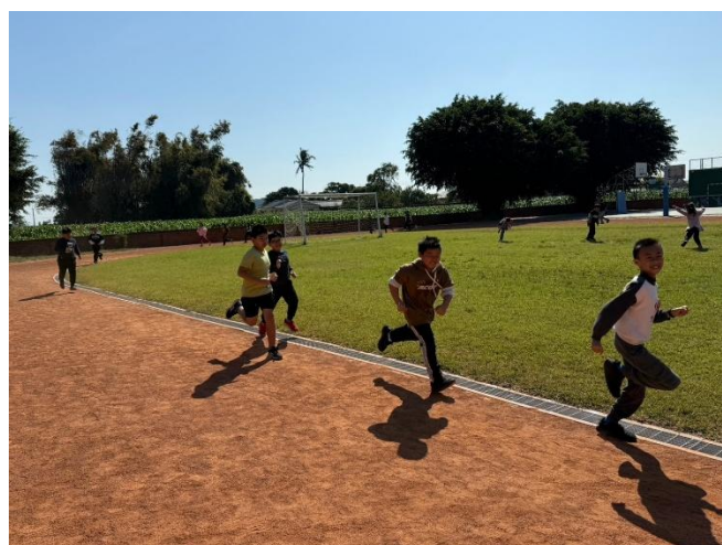
學生利用下課、晨光時間進行跑步