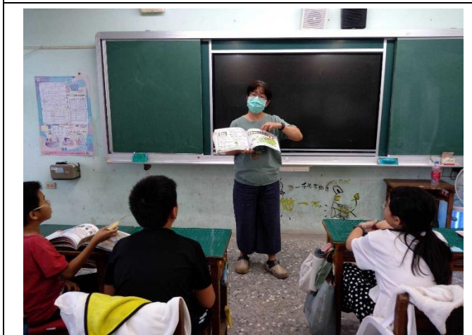
餐前5分鐘-書籍介紹(六甲)