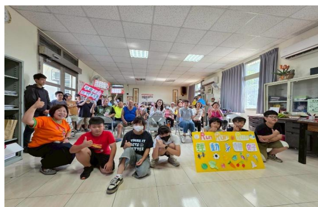
和社區長輩大合影