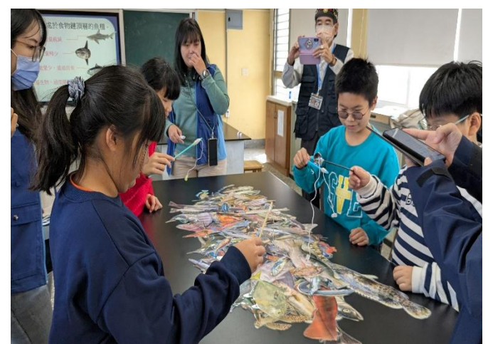
進行認識在地魚類小遊戲