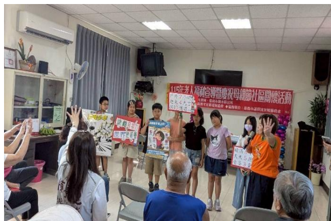
學生向社區長輩宣導健康促進議題~ 視力保健、拒菸及登革熱防治