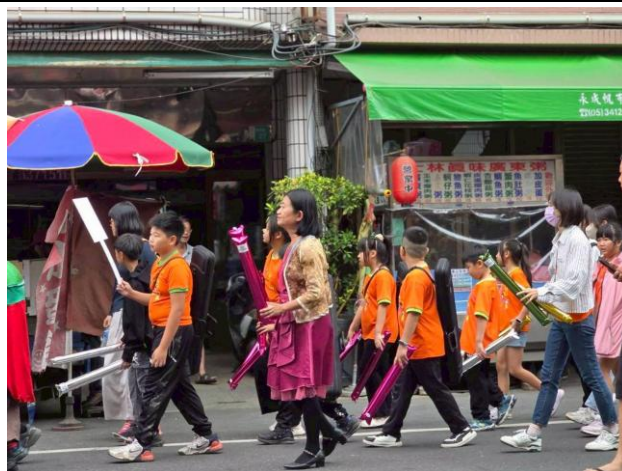
利用步行的方式參加鹽水意麵節