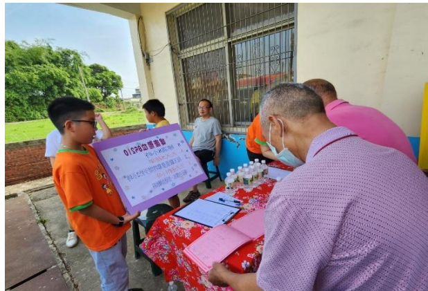
小志工向社區民眾宣導 85210