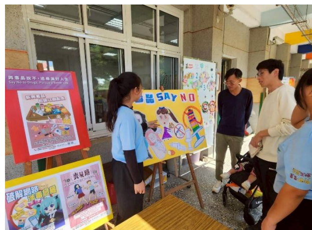
學生向家長說明 反毒創作理念