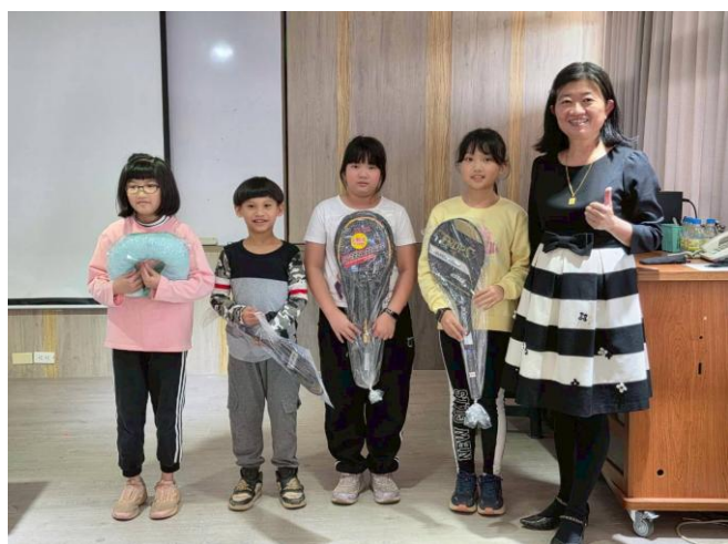
添購 羽毛球拍 作為大跑步計畫之摸彩品