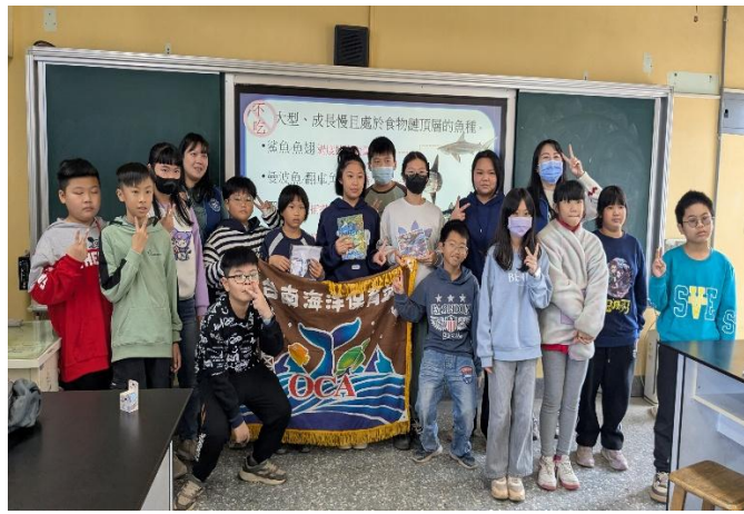
海洋保育署台南海洋保育站到校進行飲食(食魚)教育