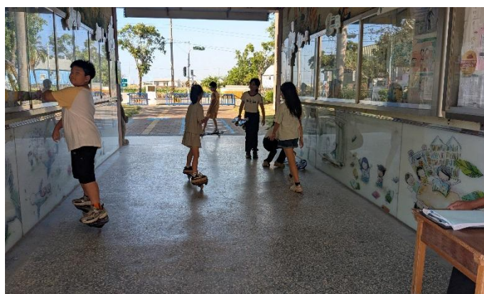
週三、五晨間運動時間-蛇板(中年級)