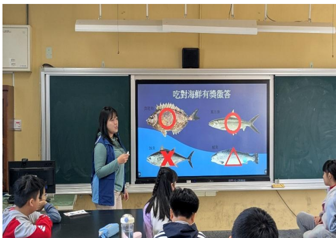
進行吃對海鮮有獎徵答小遊戲