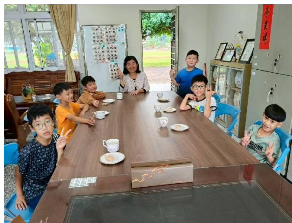
三年級 與校長有約