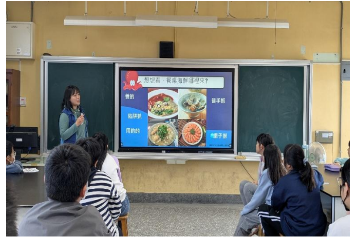
認識餐桌海鮮是如何來的