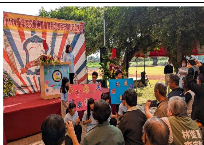
校慶時向來賓及社區家長進行拒絕網路成癮議題宣導(四年級)