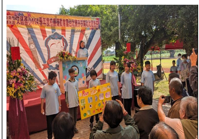
校慶時向來賓及社區家長進行健康體位多運動保健康宣導(五年級)