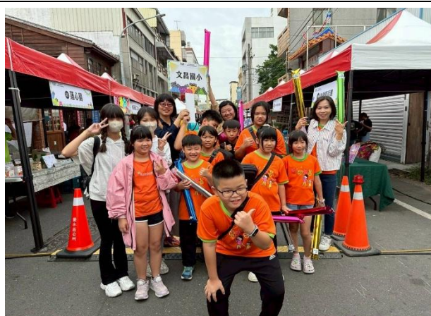
學生假日時踴躍參與社區活動