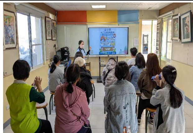
提醒 電子菸 可能隱藏毒品：依托咪酯