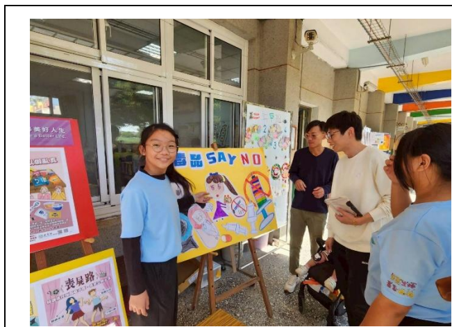
學生向家長進行 正確用藥 宣導