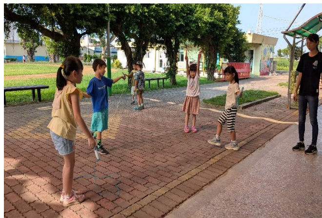
週三、五晨間運動時間-跳繩(低年級)