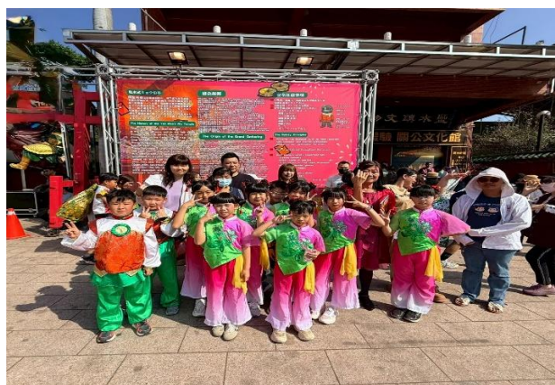
家長陪伴孩子參加活動