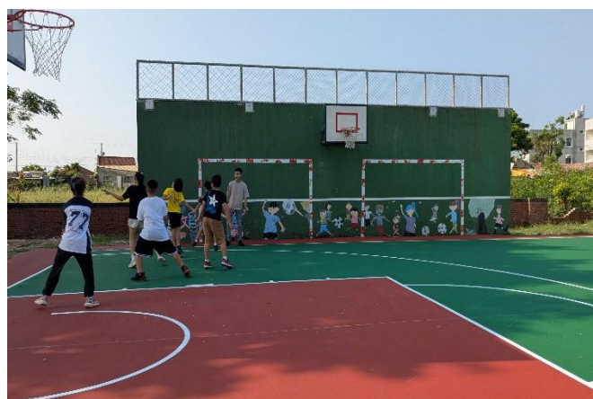
星期四課後籃球社團