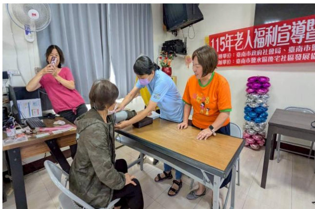
護理師協助社區民眾量測血壓