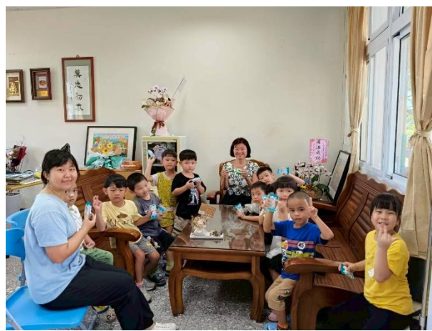
幼兒園 與校長有約