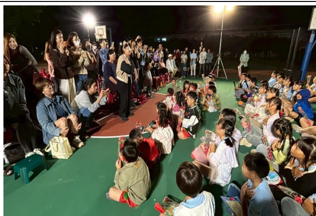
家長熱情參與，給予孩子鼓勵與掌聲