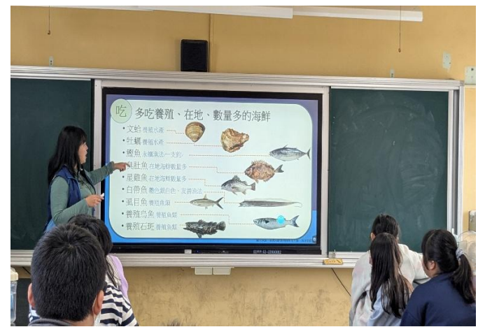
教導學生多吃在地海鮮，培養低碳飲食的概念