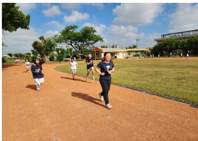
師長與學生一起進行晨間運動(跑步)