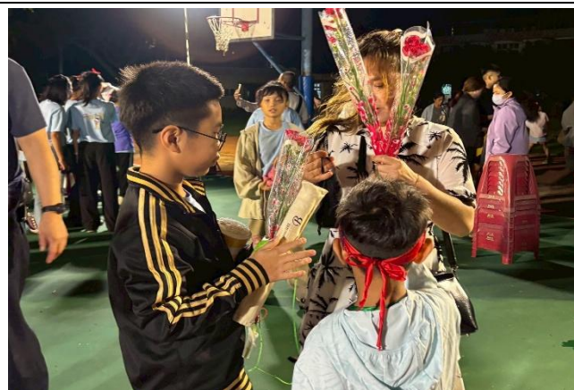
學生贈送媽媽康乃馨，跟媽媽說謝謝