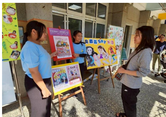
學生向家長進行 防制藥物濫用 宣導