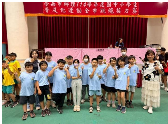
普及化運動：跳繩接力