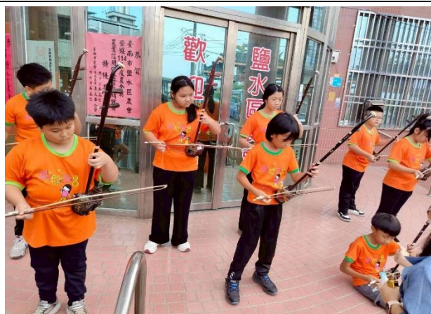
於鹽水區公所前快閃演出