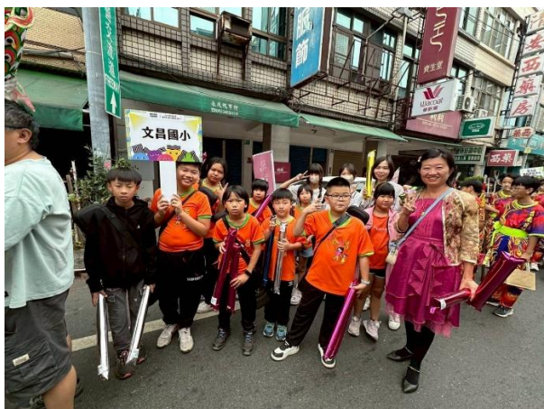
利用步行的方式參加鹽水意麵節