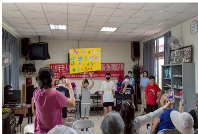
學生向社區長輩宣導健康促進議題~ 健康體位與多運動