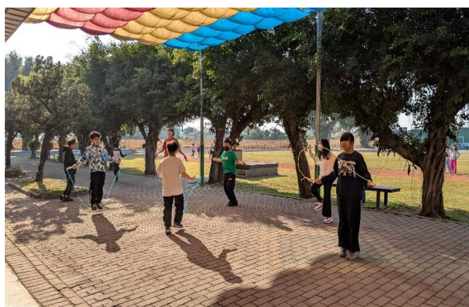
週三、五晨間運動時間-跳繩(中高年級)