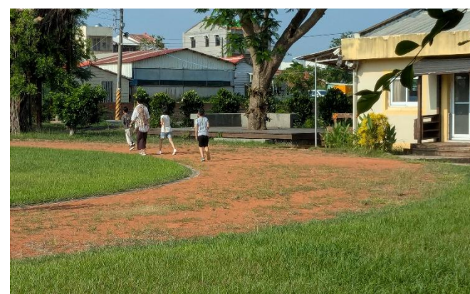
二年級導師陪學生進行晨間運動-跑走