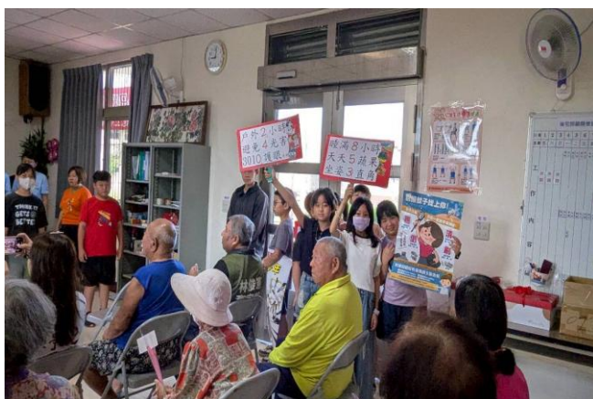
學生向社區長輩宣導健康促進議題~ 視力保健及登革熱防治