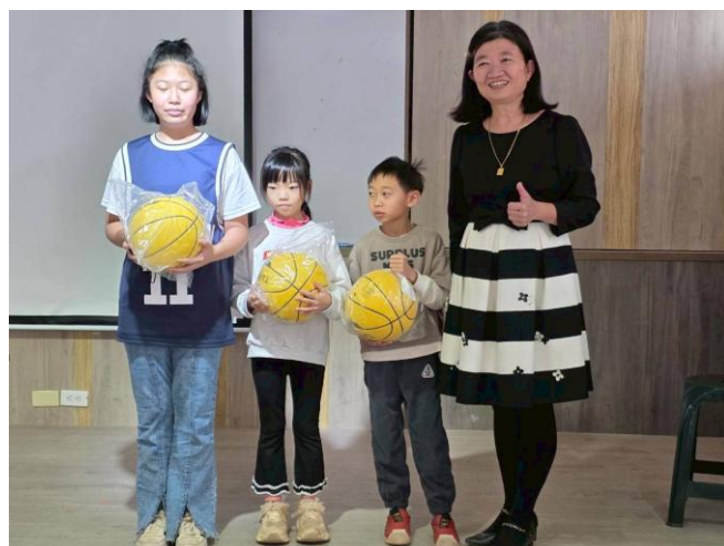
添購 籃球 作為大跑步計畫之摸彩品