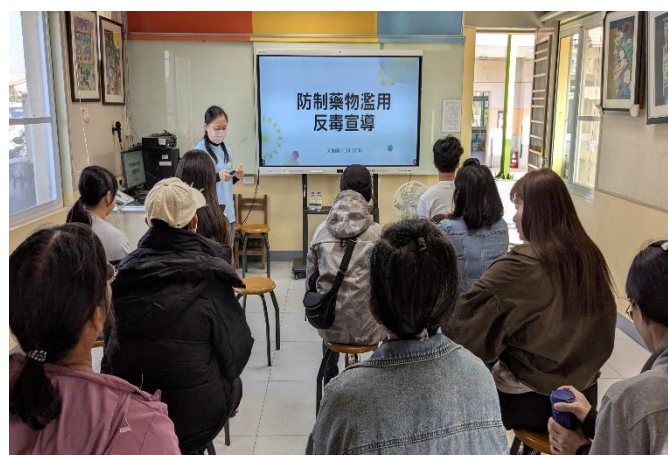
校慶時辦理家長 防制藥物濫用 宣導