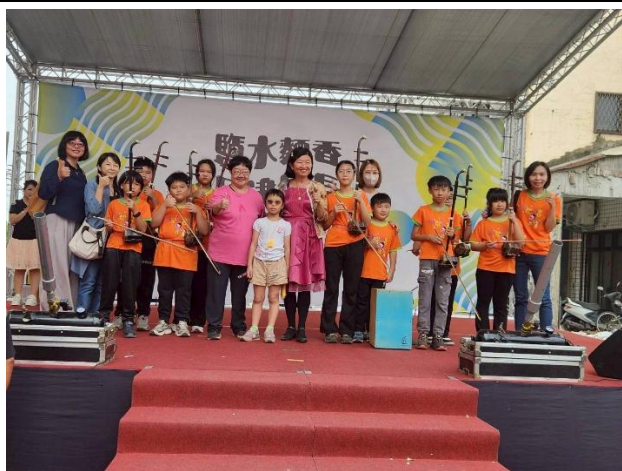
意麵節二胡表演圓滿成功