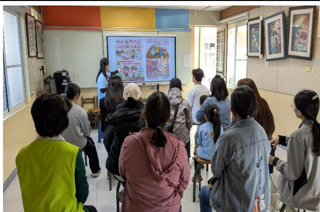
請家長們留意 新興毒品 的包裝樣態