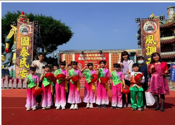
參加大台南囡仔仙拚仙活動