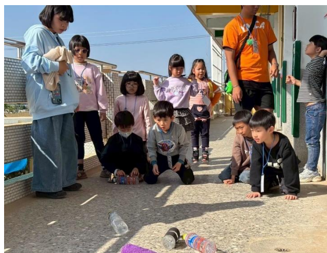
科學實驗與戶外遊戲