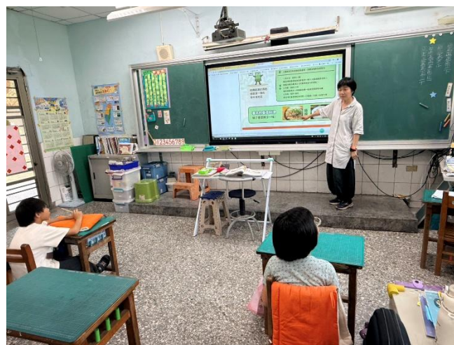
餐前5分鐘-愛恨交織的香菜(二甲)