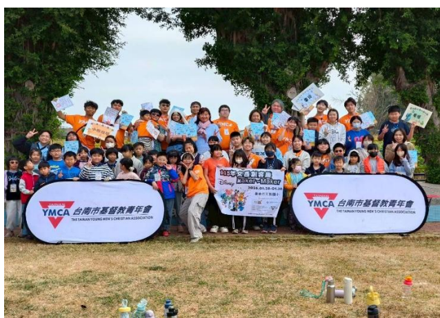
YMCA 寒假育樂營大合影